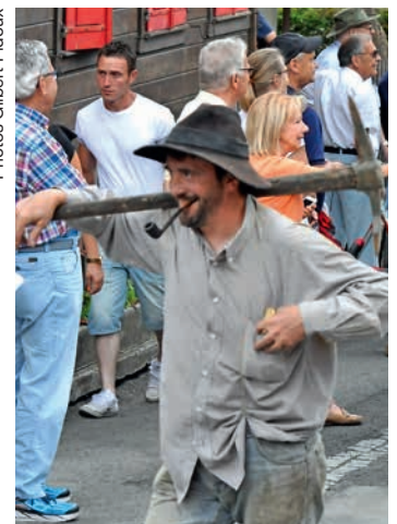
Le char vainqueur: les Hawaïens du Ski-Club. A droite, un chercheur d'or (2 e prix).