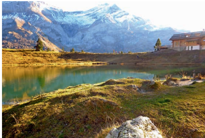
Avec Isenau, le lac Retaud est une perle sur le parcours.

mettra, en scannant les QR-codes avec un smartphone, de découvrir des textes supplémentaires, des images et même des vidéos pour compléter les explications.