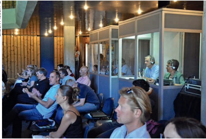
Traduction simultanée des débats en anglais et en allemand.

de montagne et de leur régions périphérique.