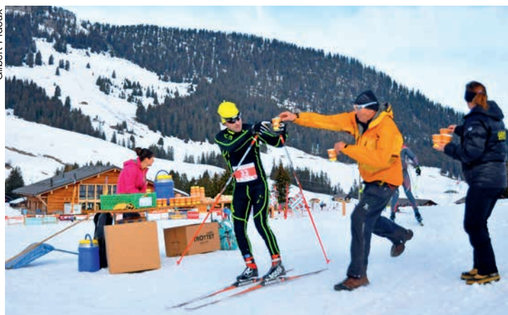
Le ravitaillement de haut vol requiert de la dextérité.

Ormonan d'ailleurs | Vous avez un message de: