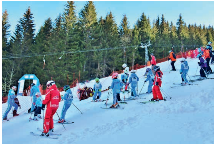
Les enfants adorent ce rendez-vous avec la championne.