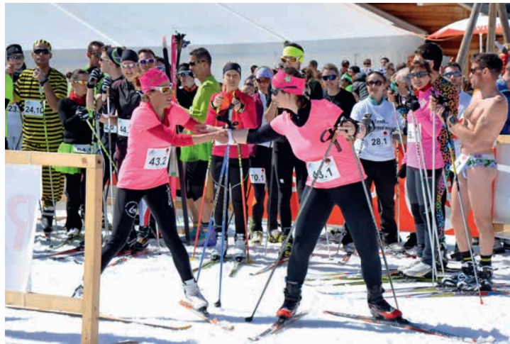
Passage du témoin devant un participant réchauffé.

championnats suisses universitaires courte distance et de finale pour les clubs du Kids Nordic Tour.