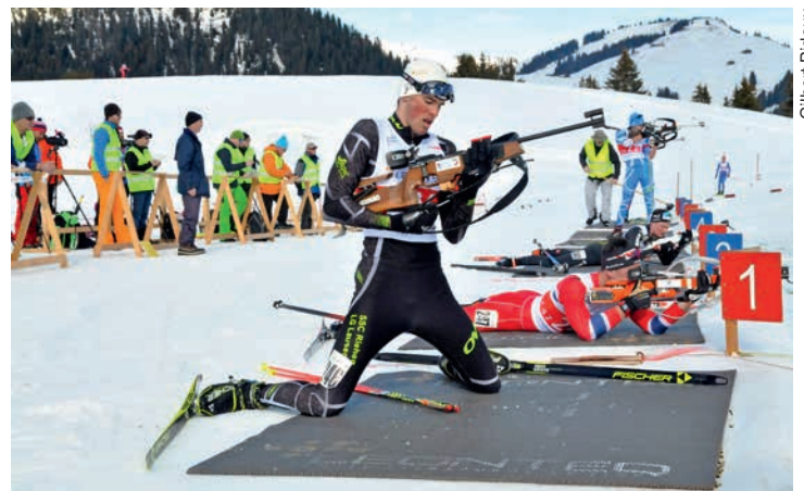
Le biathlon, qui requiert force physique à ski et adresse au tir.