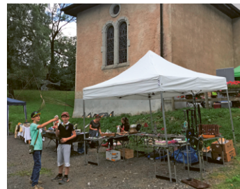
Stands pour tous les âges.

Le soleil étant de la partie, de nombreux visiteurs, gens d'ici et d'ailleurs, ont apprécié ce rendez-vous, ont eu plaisir à s'attarder devant les stands de