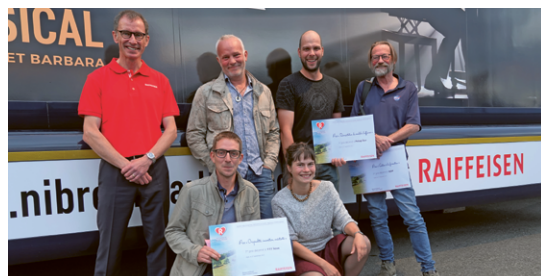
Les premiers prix du concours.

C'est le 27 septembre dernier que la banque coopérative a présenté les onze lauréats de son