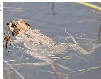
Alors, vous venez m'aider?

la route. Cela demande une bonne heure de disponibilité par semaine, entre 6h et 9h,