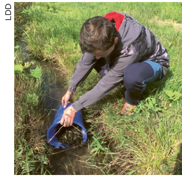
Des truitelles même ici!

Pour la mise à l'eau, les équipages sont équipés de cuveaux équipés de diffuseur d'oxygène