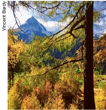
Palette de jaunes en forêt.

Ce sont donc les feuilles situées aux extrémités des branches qui seront les premières à se colorer tandis que celles plus proches du tronc resteront vertes plus longtemps. En tombant à terre, celles-ci se détériorent et forment un humus fertile pour accueillir les pro-