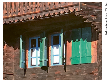
Du bleu contre les diables.

Mais pour le cas où un esprit malin se serait toutefois introduit, une petite fenêtre, une borgnette était prévue latéralement. Cette dernière était peinte en vert à l'intérieur, couleur qui attirait cet esprit, et ainsi l'incitait à ressortir. Ces pratiques apparaissent encore sur quelques chalets à La Comballaz et à La Forclaz, mais confort et isolation obligent, les fenêtres de nos vieilles demeures ont été remplacées et les témoignages de