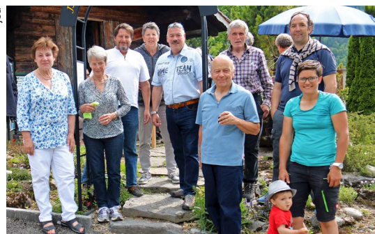
Le comité du jardin en compagnie du Syndic.