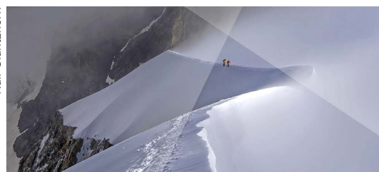
Festival à deux versants: sur site et en ligne.