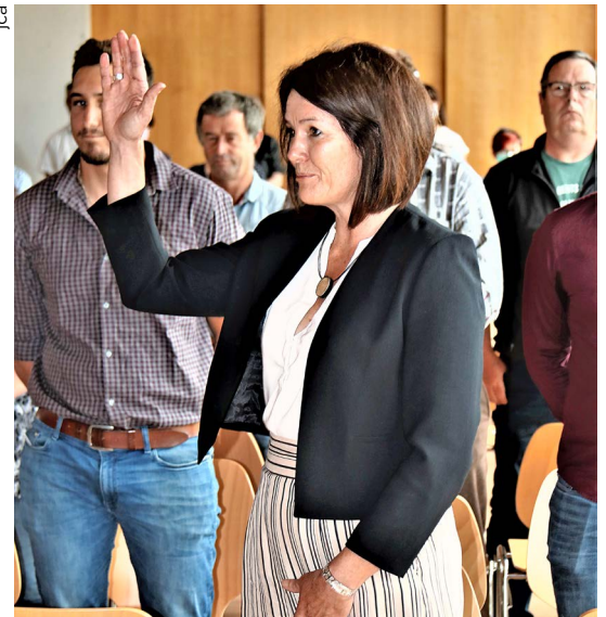
La Syndique prête serment sous l'œil du conseil.

Le 16 juin dernier, les cinq municipaux et quarante-neuf conseillers d'Ormont-Dessus ont prêté serment à la préfète Patricia-Dominique Lachat au temple de Vers-l'Eglise. Les cinq municipaux et vingt-six conseillers d'Ormont-Dessous ont choisi le 21 juin, jour du solstice d'été, pour marquer leur engagement envers la Commune, le Canton et la Confédération.