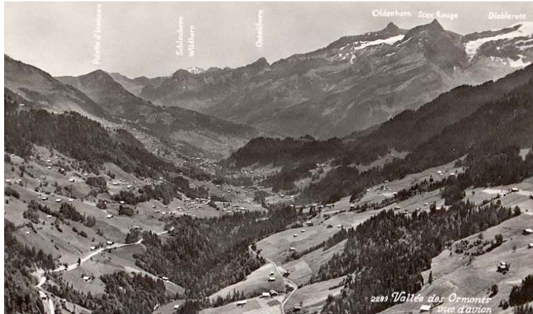
La haute vallée de la Grande Eau vers 1950.

La seyte se déploie sur le versant ensoleillé avec un étagement de hameaux, comme Les Jeans et La Gottrause vers 1200 mètres, La Ville et Le La-