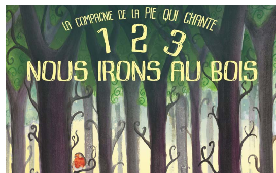
Attention, forêt enchantée cet été!

Suivez le circuit dans les bois et laissez-vous emmener dans un monde magique. L'inscription