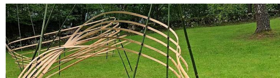
Rebondir, une œuvre à explorer à Cergnat.

La thématique de cette édition est «Transformation», un sujet en parfaite adéquation avec l'année particulière que nous venons de vivre. Riche d'une cinquantaine de pièces créées par trente-