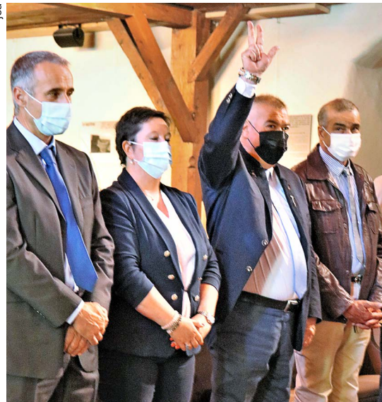
Le Syndic au serment très symbolique.