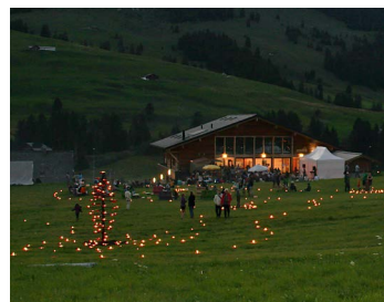
Le labyrinthe en 2020.

L'animation phare du festival aura lieu le samedi 24 juillet à 19h à l'Espace nordique des Mosses où nous serons conviés