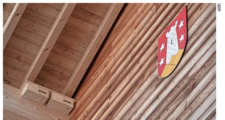
Exemple de nichoirs visibles sur la face ouest du bâtiment.