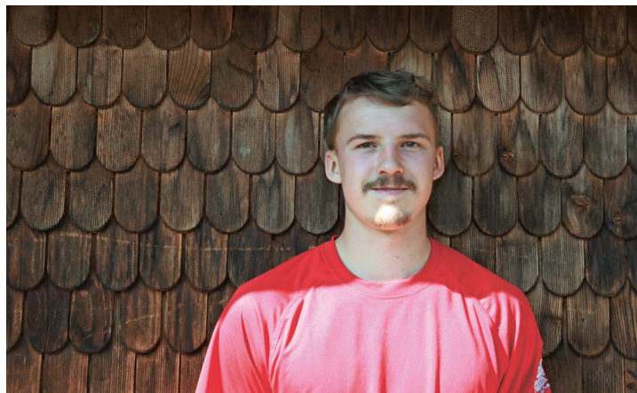
Bûcheron, c'est un beau métier!