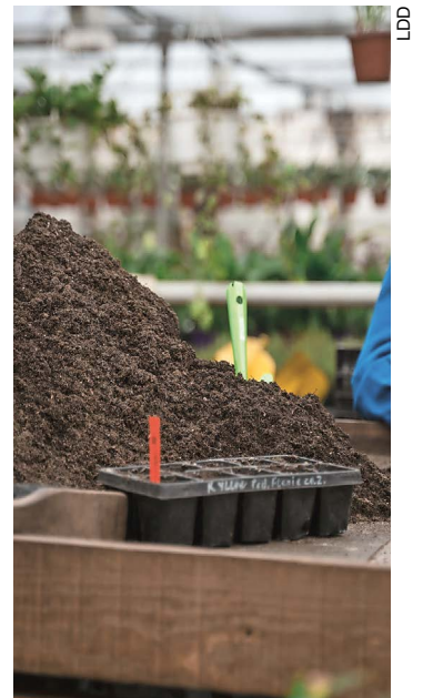
La magie du compost.

Soit dit en passant, la déchetterie d'Ormont-Dessous a