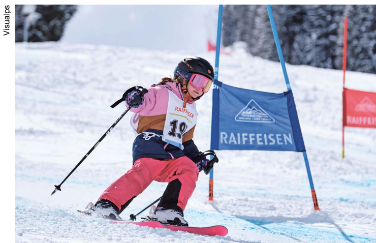
Les derniers passages de portes avant l'arrivée.

Le comité s'inquiétait des conditions de neige de printemps, mais finalement cette onzième édition du Raiffeisen Erika Hess Open s'est déroulée le 7 avril 2021, sous les flocons et dans le froid.