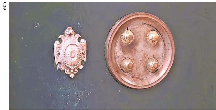
Il est loin le temps où le coffre-fort était le trésor de la bourse!