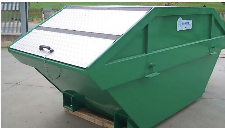
Raphaële Brugger Une benne verte uniquement pour les déchets... verts.

Suite à la demande de l'Association des propriétaires du plateau des Mosses, la municipalité d'Ormont-Dessous va installer une benne à déchets verts sur le parking de l'Arsat, au départ de la route de Pra Cornet.