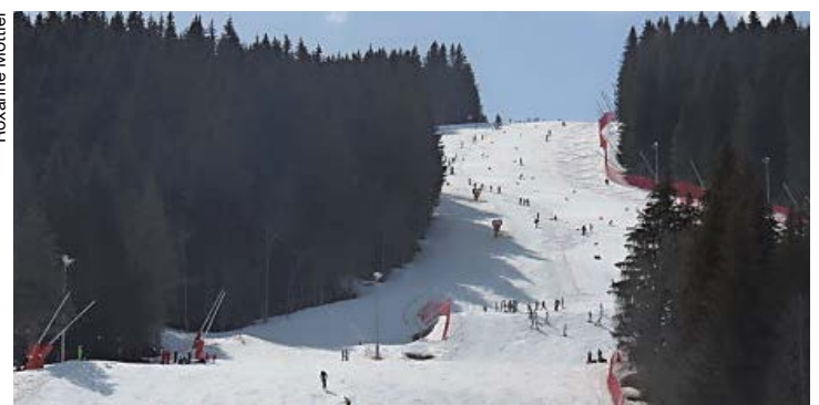
Sur la piste, des jeunes de 12 à 16 ans, issus de toute la Suisse.