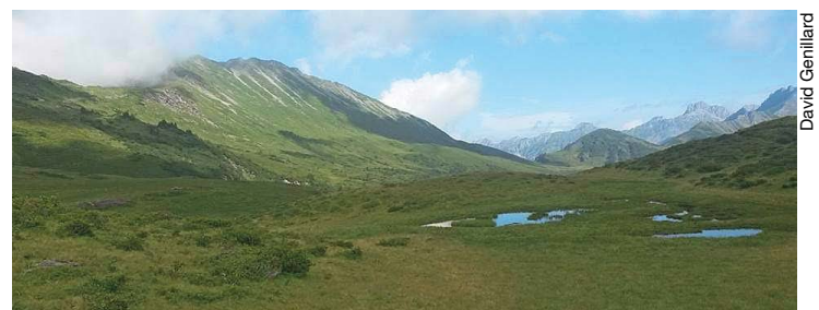
Arnon, lieu magique pour l'inspiration.

Toutes les oreilles n'accrocheront pas à sa musique, mais les cœurs vibreront à l'évocation des mêmes racines. (ebh) Plus de son sur lecotterg.ch