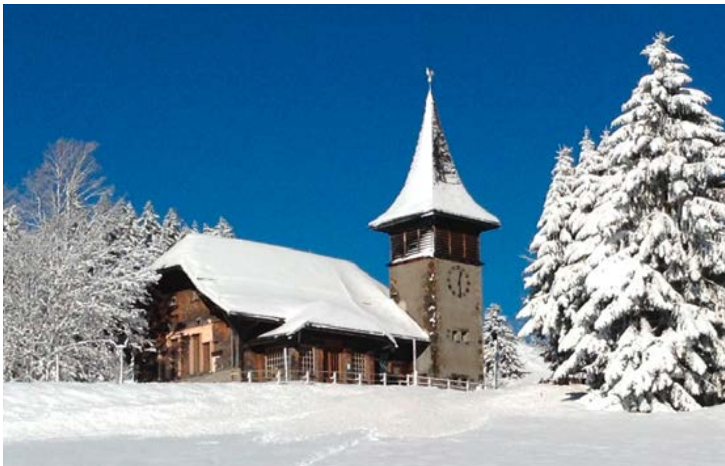
Un point de vue inhabituel sur l'église des Mosses, capturé par Bridget Dommen le 5 janvier 2014.

Cette photo était la seconde sélection de la rédaction. En sus, nous avons créé une galerie des propositions reçues. Vous les trouverez en page 3, avec les vœux des artistes. « Au retour d'une balade en hiver il y a quelques années, je n'ai pu résister à capter l'église dans ces belles conditions. Habitant à côté de l'église dont l'horloge gère ma gestion du temps, cette photo symbolise tout ce que je sou-