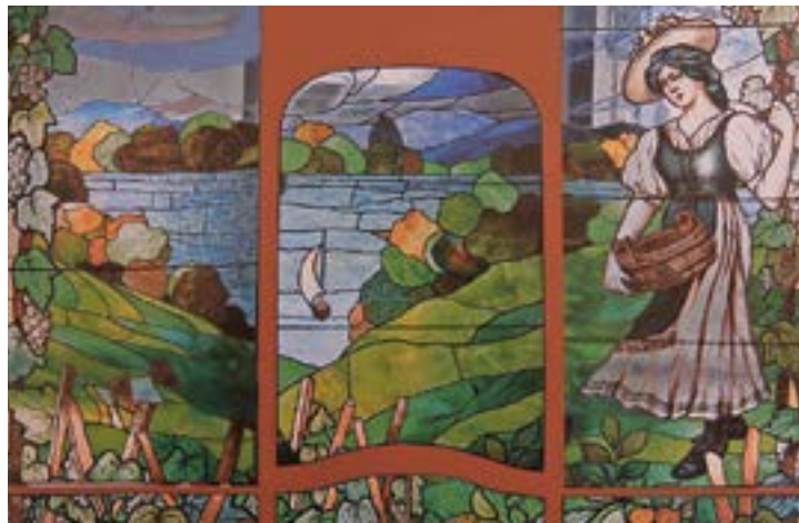
Détail de la reconstitution du vitrail du Café de la Banque.

Il est bien clair que cet ouvrage ne se lit pas comme un roman, mais, pour ma part, je l'ai consulté comme une source inépuisable d'informations notamment grâce à la table des matières qui comprend neuf chapitres intitulés: Le cadre du paysage – Préhistoire et période médiévale – De la Maison de Savoie au Canton de Vaud – Le pain, le sel et le vin – La population – Bâtiments, cultes et écoles –