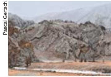
... et paysages époustoufflants.

En achetant cet ouvrage, vous l'aidez à poursuivre son effort, en particulier par la formation