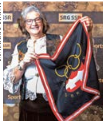
SRF/Valeriano Di Domenico

Lise-Marie est revenue sur sa carrière et a commenté en riant certaines images: «Je me demande si c'est vraiment moi qui skiait si bien!». A la question de l'évolution du matériel, elle évoque les bouts de sagex sous sa combinaison qui servaient à amortir le choc des piquets rigides tapant ses épaules, déjà bien abîmées par des hématomes. Après son accident, elle a continué à transmettre sa passion en enseignant le ski et dit «avoir essayé de penser aux conseils