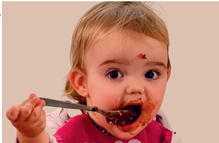
Les seniors comme les juniors s'intéressent au chocolat!