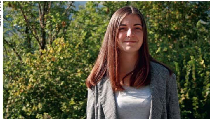
J'aime aider mon papa à réparer les toits et à remuer les bêtes.

– Etudier le journalisme ? – C'est ce que j'aurais voulu faire. J'avais eu un avant-goût de ce métier avec Radiobus. Mes profs m'avaient encouragée dans cette voie. J'avais aussi fait des stages dans différents studios de radio. J'ai commencé le gymnase dans le but de faire cette formation. – Un but un peu difficile ? – Le gymnase ne me convenait pas et j'ai arrêté à la fin du premier semestre. Malheureusement, je n'avais pas encore 18 ans pour commencer cette formation et je n'avais pas de maturité en poche. Je me suis