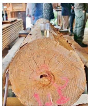
Et santé pour la scie!