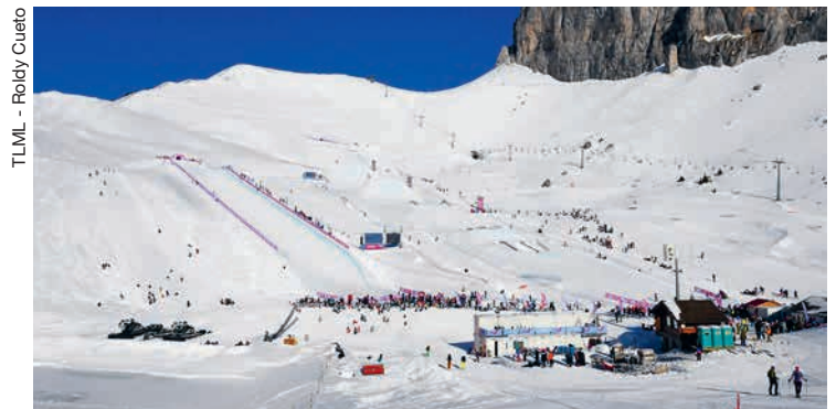
TLML - Roldy Cuetio

mille francs dans le but de garantir ses flux de trésorerie. L'accueil du camp d'hiver de la Fédération vaudoise des jeunesses campagnardes à La Lécherette en février 2020 et bien évidemment les Jeux olympiques de la jeunesse Lausanne 2020 ont été les autres événements marquants de la saison. Ces derniers se sont déroulés, sous un soleil radieux et sur des pistes parfaitement dessinées. ( ebh )