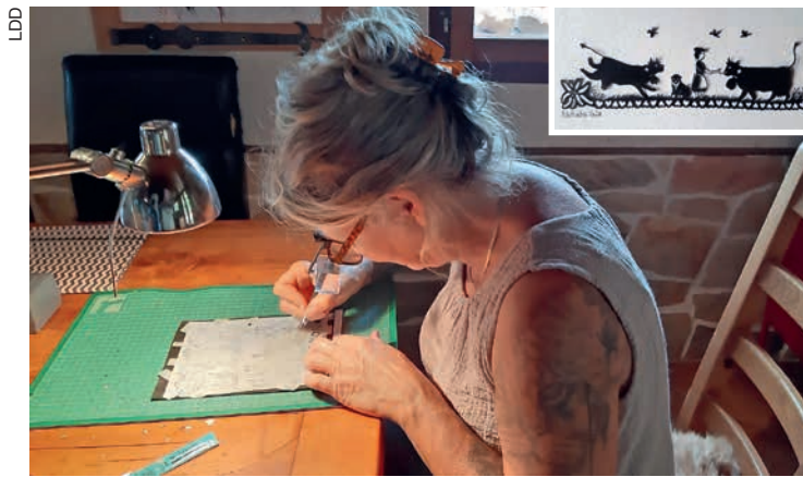
Concentration et minutie pour découper de jolies scènes.