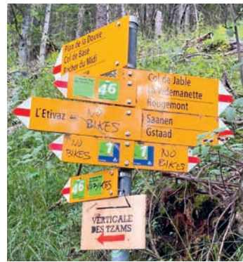
Est-ce une façon d'établir le dialogue? Vaud Rando en doute.

Les Diablerets | Une animation sportive et familiale qui a fait l'unanimité à la mi-septembre