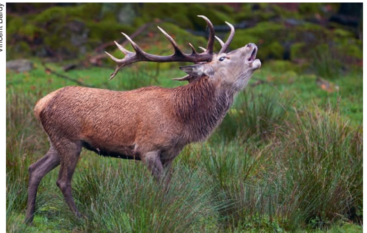
Il ne manque que le son à cette image!

Le brame permet aux cerfs d'avertir les femelles de leur présence. C'est ce cri si spécifique – ressemblant à celui de l'ours et qui peut être très impressionnant si on ne s'y attend pas – qui rend sensibles