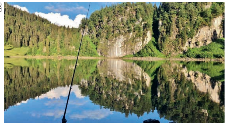
Pêche tranquille au lac des Chavonnes.

La journée s'est poursuivie dans une joyeuse ambiance à la cabane de la pisciculture à Leysin, où les «compétiteurs» se sont retrouvés avec leur famille pour partager l'apéritif, avant d'enchaîner sur une succulente raclette. Le dessert, constitué d'excellents gâteaux, a été concocté par