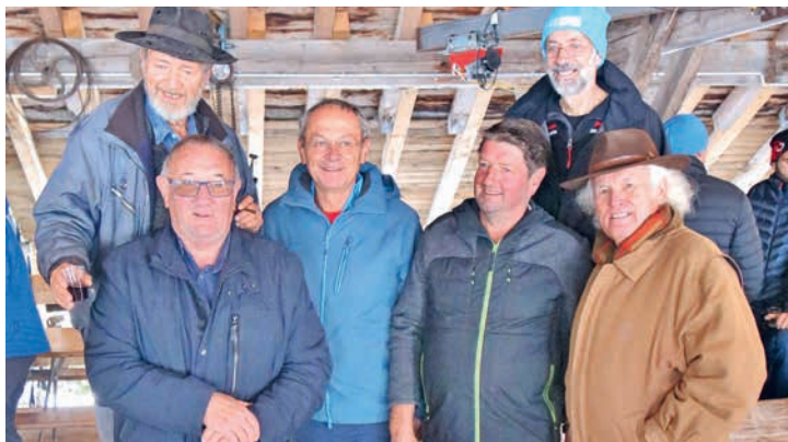
L'équipe de choc qui met la main à la pâte pour la Fondation.

Bois et neige, le tout arrosé d'un bon vin blanc et d'une raclette, voilà tout ce qu'il fallait pour passer une agréable matinée à la Scierie des Planches, le 26 septembre dernier.