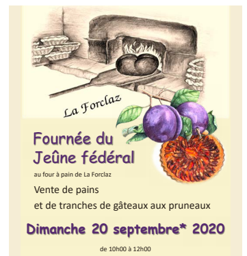
Couverture du livre souvenir et affiche de la fournée 2020.