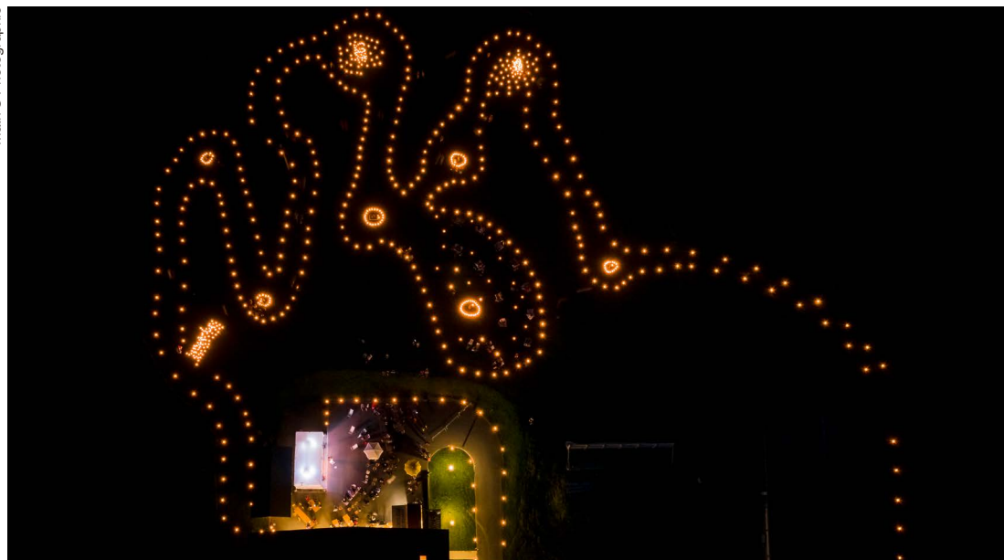
Sentier lumineux ou animal s'abreuvant à la Maison de l'Espace nordique?

Cet été, des événements majeurs ont été annulés: ainsi les prestations des fanfares, la Nuit des diables, la Fête nationale ou encore les marchés du Tilleul au Sépey. Mais avec l'assouplissement des règles, les comités d'organisation ont aussi choisi d'autres options.