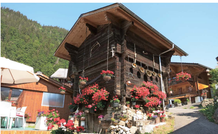
Un grenier fleuri du haut du village.

A vous tous qui avez manqué les trois balades guidées, organisées à la perfection par les Sociétés de développement de Cergnat et du Sépey, sachez qu'elles ont rencontré un franc succès. Elles avaient lieu les 25 juillet, 5 et 13 août.