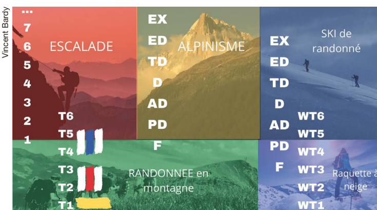
Comparison des cotations et couleurs des indicateurs.

Lors de vos randonnées, il est impératif de planifier votre itinéraire et de connaître les difficultés auxquelles vous allez faire face. Vous avez donc la possibilité de comparer votre parcours selon une échelle de degré de difficultés techniques. Pour la marche en plaine ou la randonnée en montagne, cette cotation se présente sous la forme de balisage de couleurs (voir illustration): - jaune : pour une marche sans exigence technique et