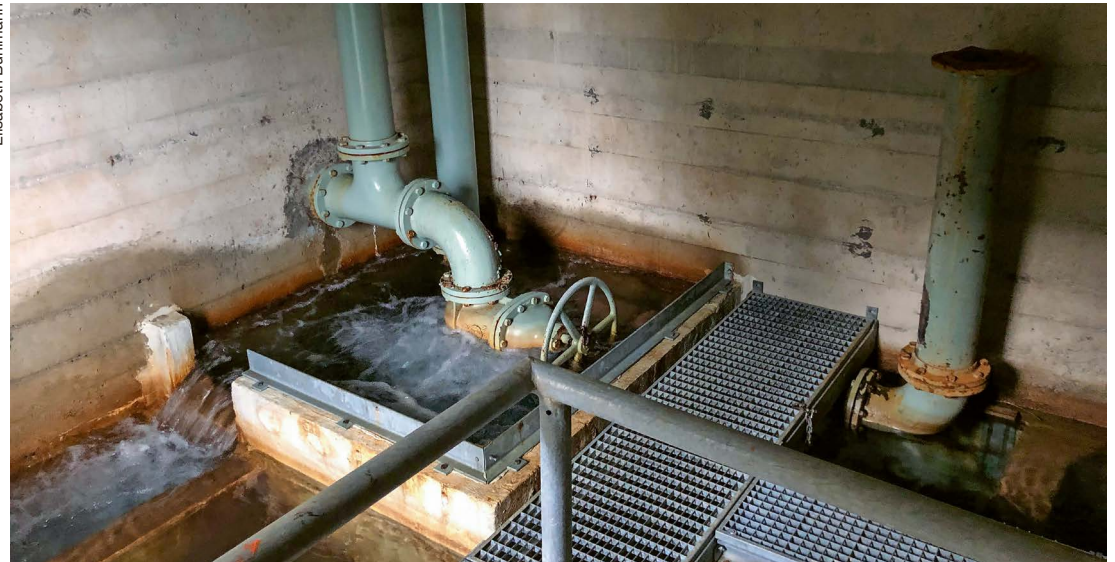
Coup d'œil sur la chambre de mise en charge au Lioson et ses bassins pour filtrer les sables.

Le 1 er juillet, comme plusieurs communes des cantons de Vaud et de Berne, Ormont-Dessus émet une alerte pour faire bouillir l'eau. Les violents orages des jours précédents ont ruisselé dans certaines sources. Une occasion pour Le Cotterg de remonter le filet d'eau de notre robinet.