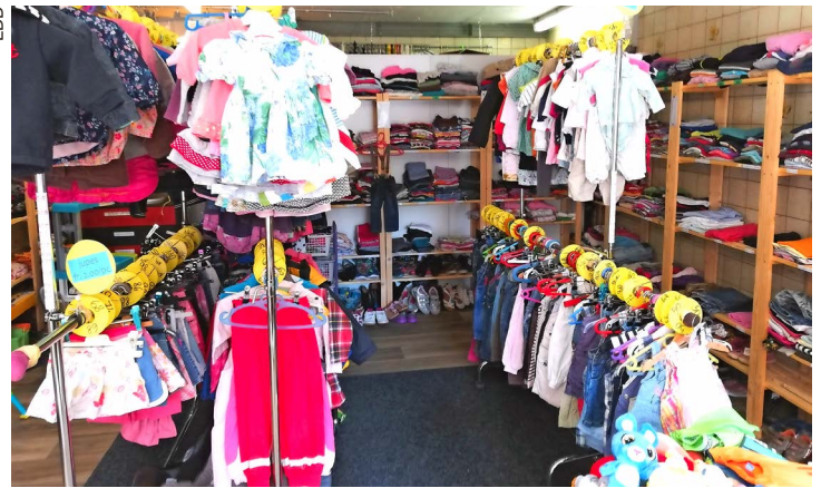
Vue du magasin réaménagé et prêt à recevoir vos dons.

L'essentiel du bénéfice de ses ventes est consacré aux aides individuelles ou collectives en faveur d'enfants de notre région. Au fil des ans, ces subventions ont été distribuées à des camps ou des courses scolaires, aux Passeports-Vacances, aux garderies de