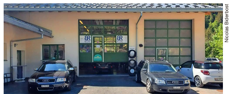
Le numéro pour contacter le garage : 024 520 76 06.