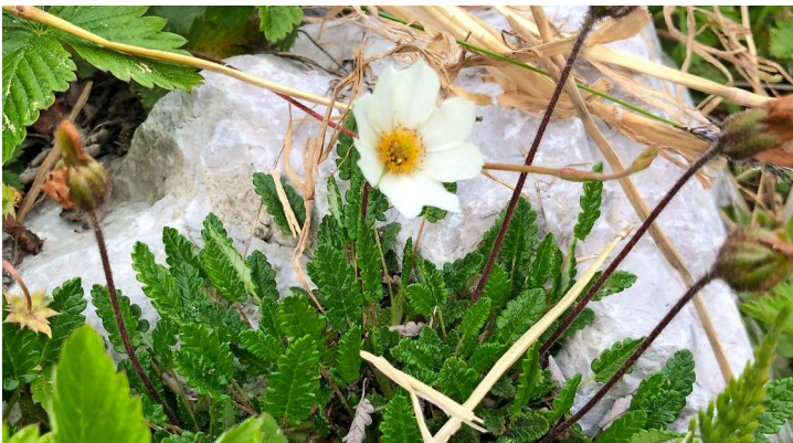
Dryade à huit pétales, thé suisse ou chênette ?

Les Tussilages, c'est un jardin alpin qui change d'apparence toute les semaines, mais aussi l'occasion d'en apprendre plus sur les plantes, durant tout l'été.