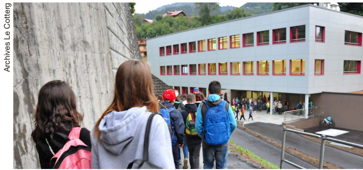
La rentrée du 27 mai, un peu comme un deuxième rentrée.