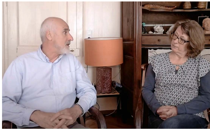
Discussion informelle au salon, image typique des vidéos.

Sur sa chaîne vidéo créée dès le début du confinement, il publie trois contenus par semaine. « Méditer dans son salon » ou le culte chez soi et « S'en sortir sans sortir », un moment de prière, illustré par chacun des six lieux de culte de la région. Dans le Chablais, chaque paroisse a créé ses propres canaux pour présen-