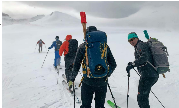
Les traceurs dans le brouillard en direction du Seeberghore.