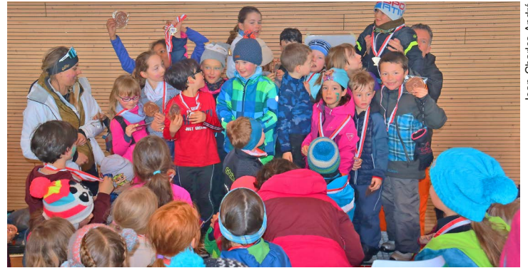
Jeunes en liesse pour la remise des prix et la photo de groupe.

Après une journée bien remplie, les médailles des Jeux divers sont remises à chaque