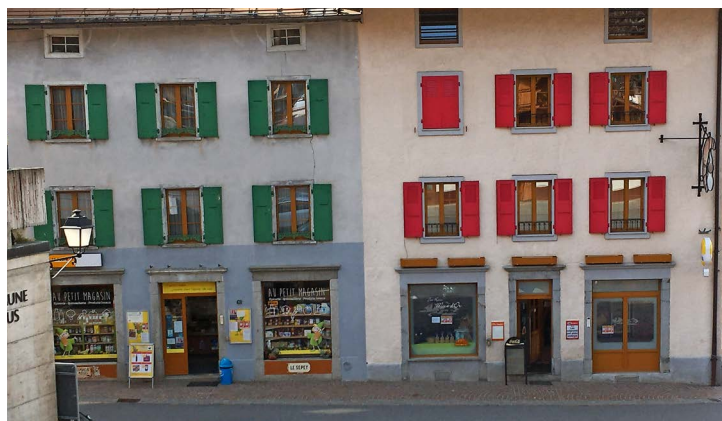
Voisins et solidaires : le Petit Magasin et le Tea-Room Mont-d'Or.

Soucieux de rassurer une clientèle inquiète pour sa santé, les commerçants d'alimentation du Sépey se mettent en quatre.