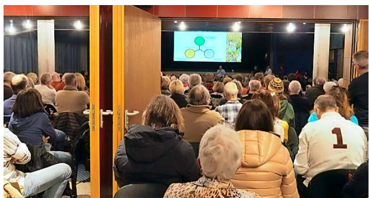
On manquait de places assises pour suivre la présentation.

La séance d'information du groupe Isenau 360 s'est déroulée le 22 février dernier devant une salle comble. Elle appelait aux synergies.