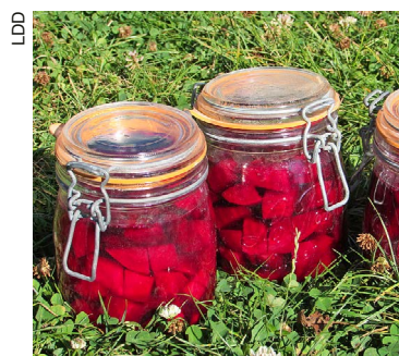
Carottes ou betteraves rouges?

Le nettoyage de printemps s'approche, pensez aussi à partager vos secrets pour l'entretien et la rénovation de la maison ou du mobilier.