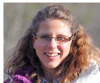
Son sourire, une évidence!

eu raison de nous... mais pas entièrement, puisque nous profitons de ces lignes pour te remercier pour tout ce que tu apportes aux Ormonts et nous réjouissons de pouvoir continuer à collaborer avec toi. (ebh)