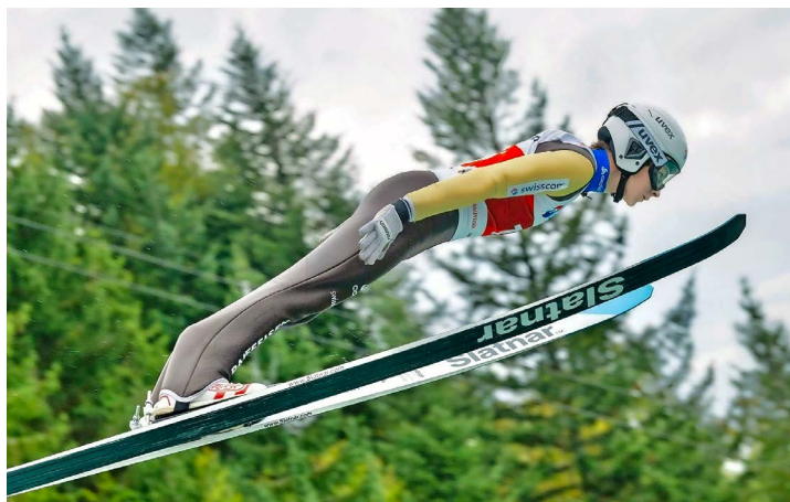
Le saut est un sport toujours en progression.