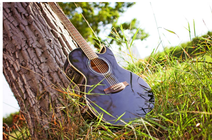
Musique au grand air et esprit champêtre aux Diablerets.

Les Diablerets | Fête au village à la fin juillet