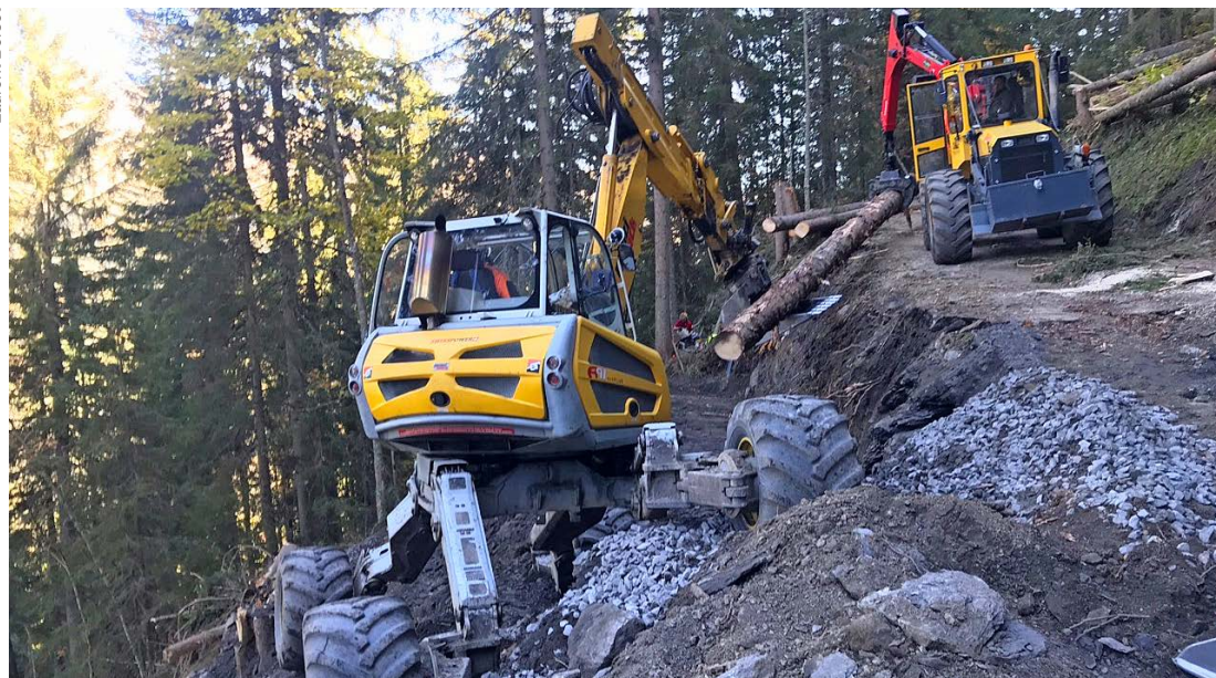
L'équipe du groupement forestier en plein travail pour construire les caissons.

C'est une route étroite mais fréquentée qui mène en Perche depuis La Forclaz. Les pentes sont raides, le massif friable, les cours d'eaux multiples. La route a particulièrement souffert durant l'hiver 2018, exigeant une campagne exceptionnelle de travaux sur deux zones principales.