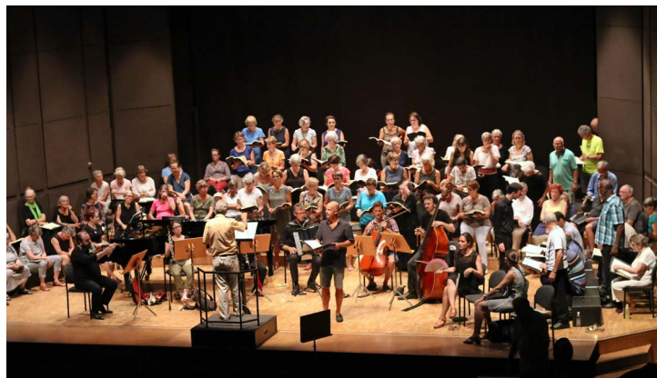
Les stagiaires de Musique & Montagne en pleine répétition.

Billetterie en ligne sur www.musique-montagne.com , auprès de l'Office du Tourisme ou sur place, avant les concerts. Brigitte Pahud