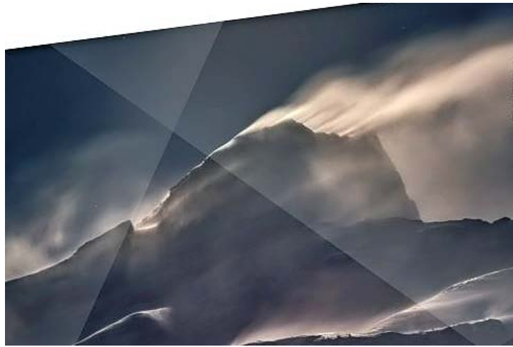
Extrait de l'affiche de la cinquantième édition du FIFAD.

ascension de l'Everest sans oxygène) autour du mérite alpin. Le lundi , c'est autour de la question du prix à payer pour l'extrême, notamment au niveau physiologique, que se dérouleront les festivités. Le mercredi sera consacré à l'environnement avec l'envie de sensibiliser le public à la fragilité de la nature et aux