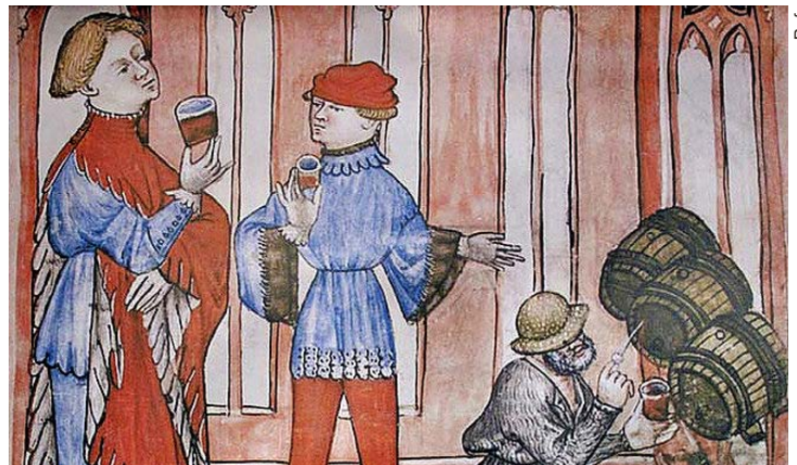
Enluminure dans le Tacuinum sanitatis , 1390.