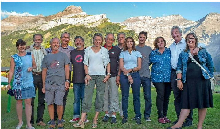
Le comité FIFAD, édition 2017, une solide et fidèle équipe.

Plans rapprochés sur la préparation du cinquantième, et les leitmotifs de cette édition anniversaire.