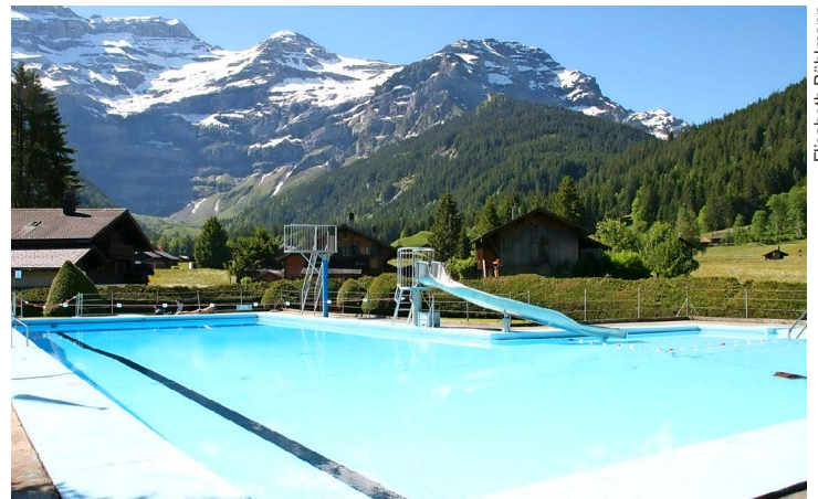
La piscine et son toboggan n'attendent que vous.

Voir le nouveau site du Parc des Sports: www.diablerets-pds.ch