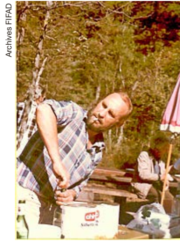
La raclette des guides.

1985, la vidéo entre au festival. Le film se scénarise suite aux fondements posés par Marcel Ichak avec l'utilisation de la caméra portative et l'interview d'alpinistes. Ces cinquante ans narrent les exploits, racontent l'histoire de ceux qui sont morts ou de ceux qui ont choisi d'autres voies. Et pour chaque étape, le FIFAD a une