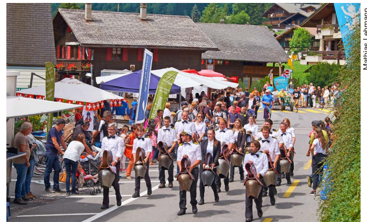
Cortège des Diables en fête en 2018.

Ce sera la fête au village pour le dernier week-end de juillet. Animations multiples pour tous les âges, à l'occasion des Diables en fête.