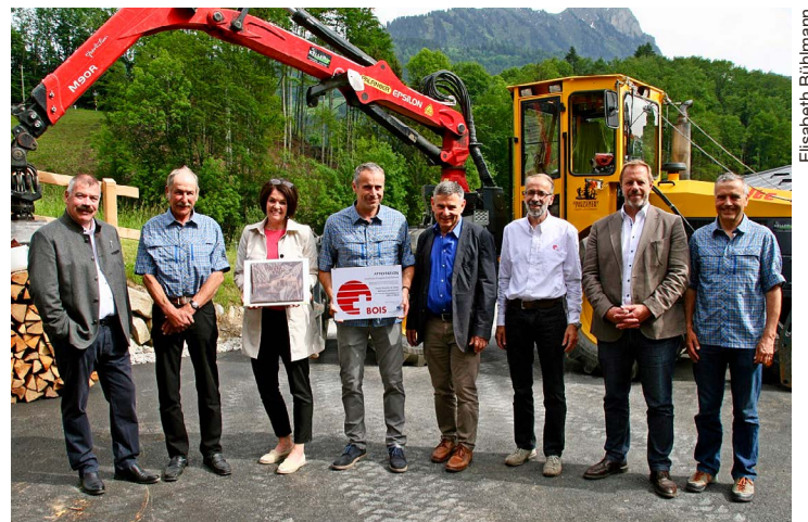
Les officiels ont répondu présent pour l'inauguration.

Photos sur le site web du Cotterg. Infos sur www.gflo.ch