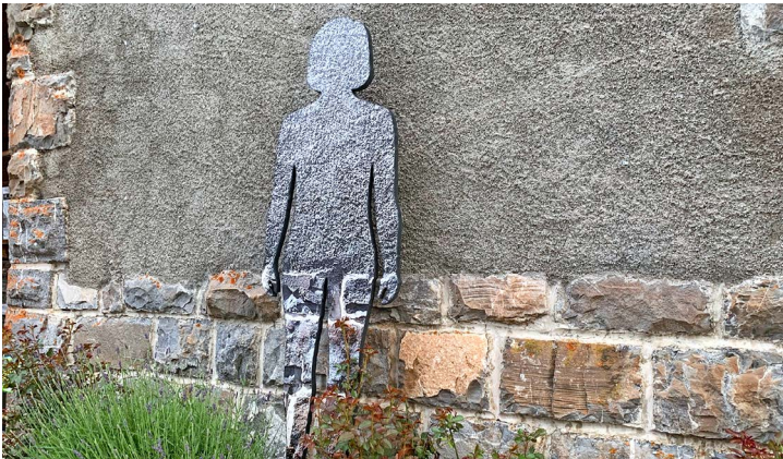
Une des sculptures "The Others" au temple des Mosses.

Le millésime 2019 d'Ailyos, l'exposition Art Nature (Aigle Leysin Les Mosses) se déroulera sous le signe du partage et de la rencontre.