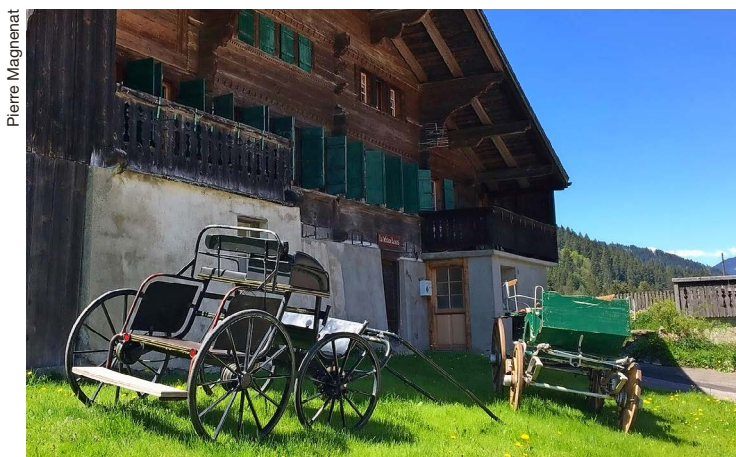
Les calèches visibles près d'un point d'intérêt du parcours.

Si, en passant entre le Musée des Ormonts et l'église, vous ressentez soudain un fort coup de vent, pas d'inqui-