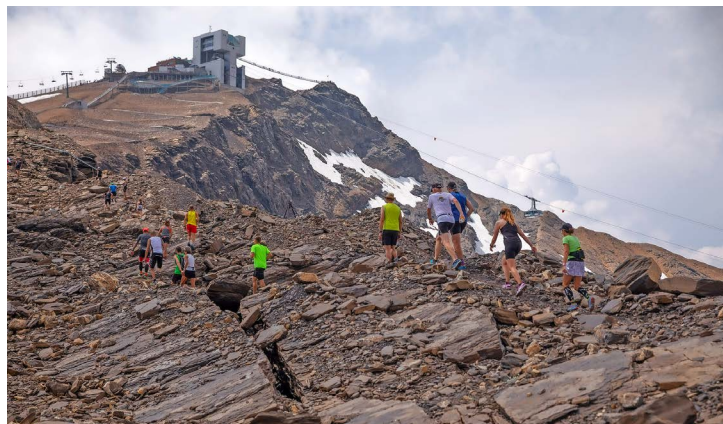
Et ça monte jusqu'au finish pour la Glacier 3000 Run.

La 12 e édition de la Glacier 3000 Run et la 8 e édition de l' Alpine Nordic Run auront lieu le 10 août prochain.