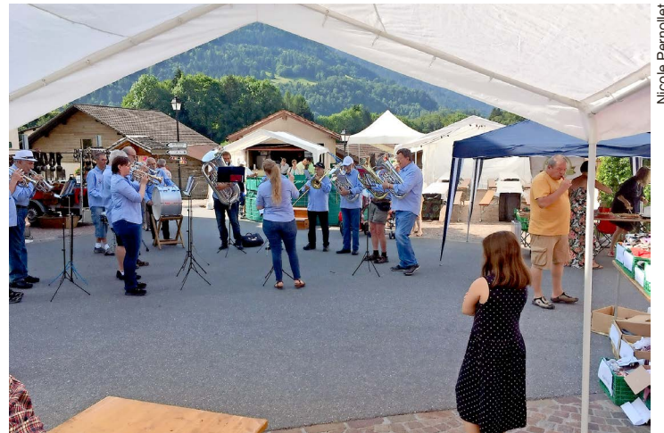
Au milieu des stands, la fanfare crée l'animation.