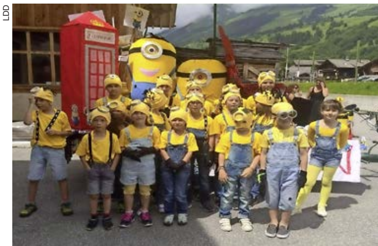
Tous les enfants sont minions! Nuit des Diables, juillet 2016.

Pour en savoir plus sur les quarante ans du ski-club de la Forclaz, consultez le site web du Cotterg , où nous avons publié la note historique préparée par son président, Martial Chevalley. (ebh)