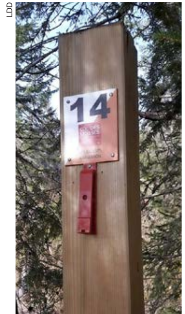
Poste de course d'orientation.

Rappelons que les Suisses sont champions du monde de la discipline. Espérons donc que cette nouvelle offre aux Mosses donnera un élan, en Suisse romande, à ce sport à