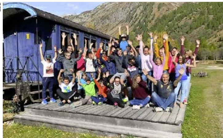
Les Goupils au camp d'Oberwald en octobre 2018