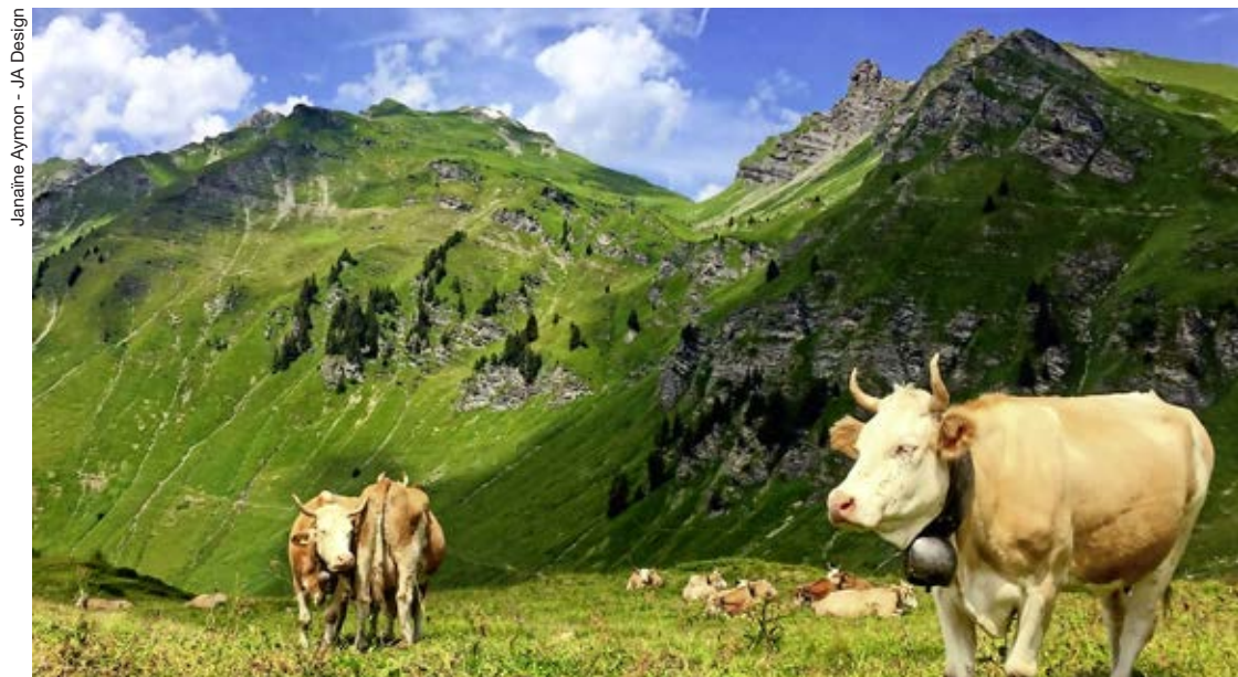
Un autre point de vue sur Isenau.

Avec une fin d'année 2018 difficile, la fondation Sauvez Isenau et la commune des Diablerets décident de remettre les choses à plat avec un groupe de travail chargé de réfléchir si un projet rentable financièrement peut voir le jour, et si oui, sous quelle forme. Aujourd'hui les premiers résultats sont communiqués.