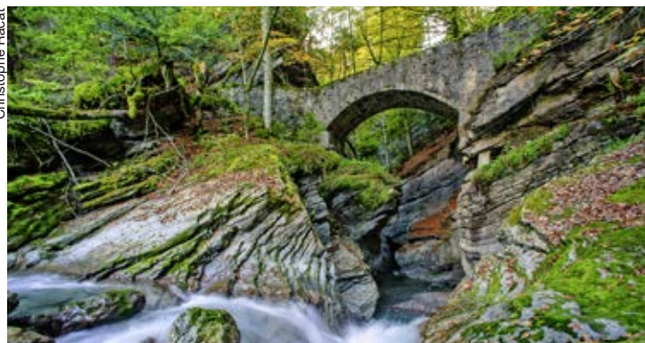
Le pont de la Tine permettant de traverser la Grande Eau.

Les Diablerets | Rapport du groupe de travail Isenau 360