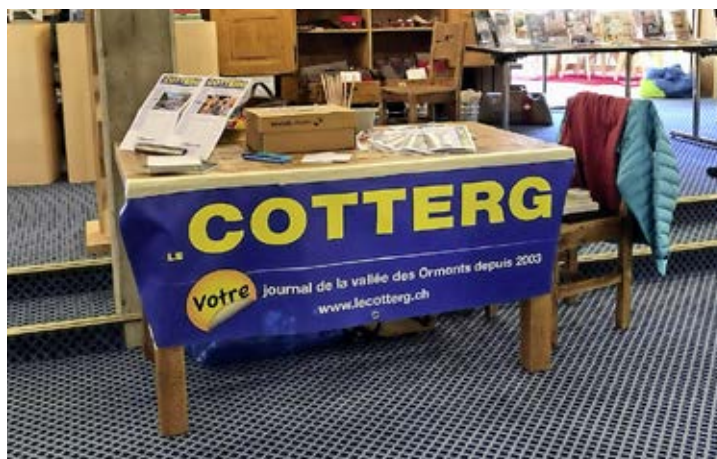
Papier, feutres et boîte à idées du Cotterg à la DIAVA 2019.

de contacter la rédaction aux coordonnées mentionnées dans l'impressum en page 12.