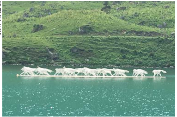
Une meute de loups s'enfuit sur le lac Lioson.

magnifiques, à la fois réalistes et poétiques, gravées sur des façades de chalets. Œuvres qu'il signe d'un LPVdA mystérieux qui signifie simplement Les Pinceaux Verts d'Antoine. «Vous voulez me prendre en photo, je n'aime pas trop me montrer... Ou de dos, si vous y tenez».