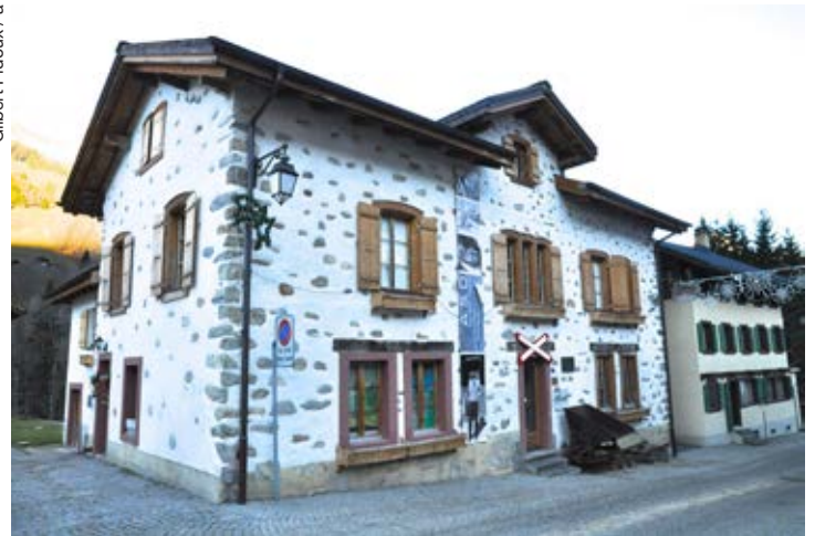
Dans sa superbe bâtisse de Vers-l'Eglise, le Musée des Ormonts est excentré, mais il mérite largement le détour.

Les musées bougent. Ils ne doivent plus être forcément confinés entre quatre murs, à entendre le président. Ainsi, un itinéraire balisé pourrait-il conduire les visiteurs à la scierie hydraulique antique, au chalet de Tréhadèze, aménagé avec des meubles et objets d'époque. Ces témoins mon-