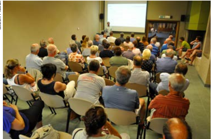
La salle est comble, preuve de l'intérêt de la population.

Les déplacements des athlètes et des spectateurs s'effectueront uniquement par des transports publics. Un axe piétonnier direct endiguera le flot des visiteurs entre