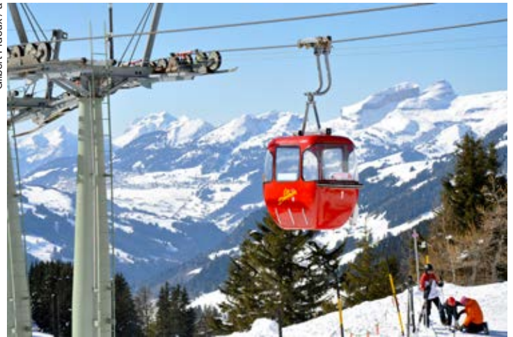
Le site et la télécabine d'Isenau sont sujets à turbulences.

b) une indemnisation de 180'000 fr. demandée par la