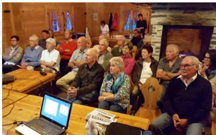
Un auditoire très attentif aux paroles du conférencier invité.

Le verre de l'amitié sera servi à l'issue des réunions. (gpx)