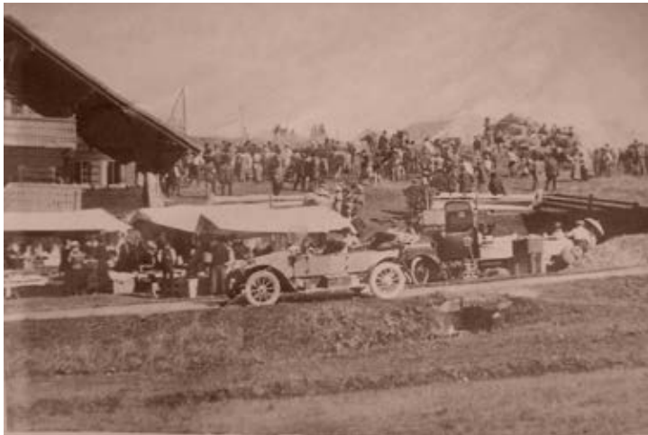
Beaucoup de monde à la Foire des Mosses en 1916.