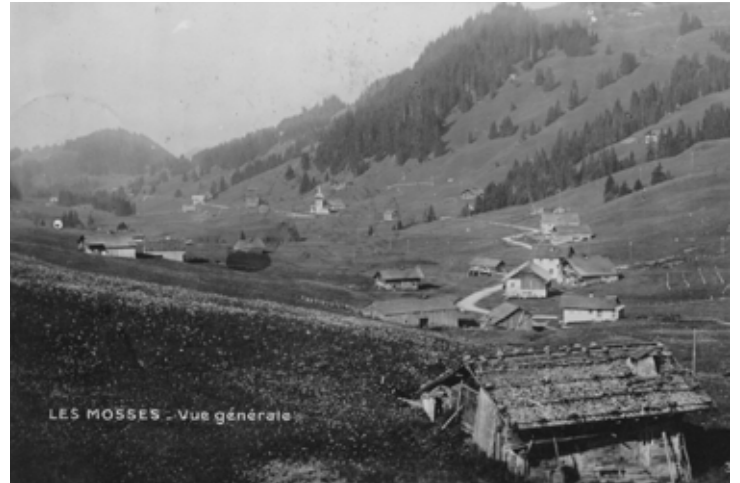
Vue des Mosses avec son pré de foire.

Si le droit de tenir une foire d'automne au Sépey a été accordé par les coseigneurs d'Aigremont en 1441, la foire des Mosses l'a été par décision du Gouvernement d'Aigle (LLEE) en automne 1761.