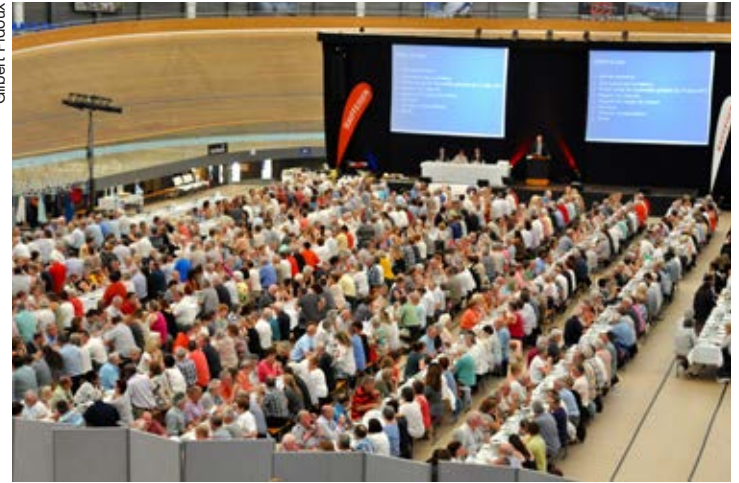
Sur 9'925 sociétaires, 815 étaient présents au CMC, à Aigle.

Le conseil à la clientèle. D'autres évolutions sont pré-