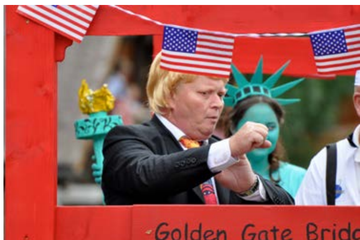
Lors de l'édition 2017, l'Amérique était au rendez-vous.