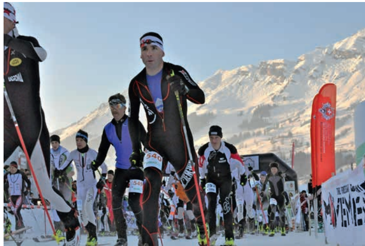
Départ pour quelques heures d'efforts exigeants.

des sportifs durant trois jours dans la station, raison pour laquelle ils ont supprimé le Super Relais du dimanche. Figurent donc au nouveau programme, la Verticale nocturne du vendredi et les deux Diaboliques du samedi: la grande avec ses 2'700 m de dénivelé et la petite avec ses 1'670 m.