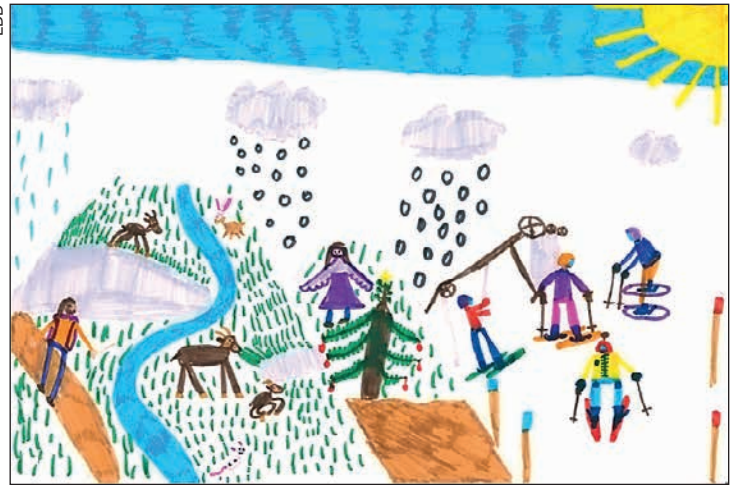
L'hiver aux Diablerets, un dessin réalisé par Audrey.

A voir, ils apprécient le tourisme vert! Pour eux, la nature domine. Pas trace de voiture, ni de bus non plus. Par contre, un magnifique dessin de l'ASD, et les cabines d'Isenau, incontournables. Mais surtout, soleil généreux,