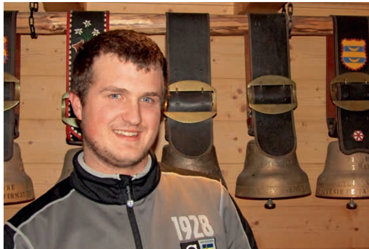
«Beni» fait partie du groupe des Sonneurs des Ormonts.