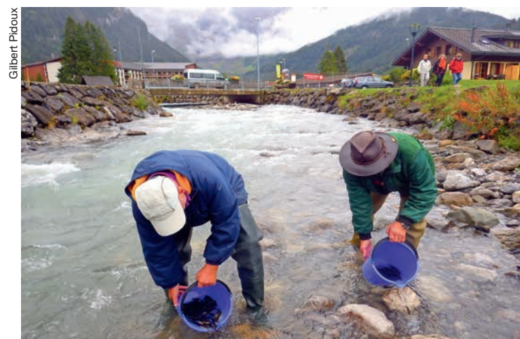
Les truitelles sont déposées délicatement dans la Grande-Eau.