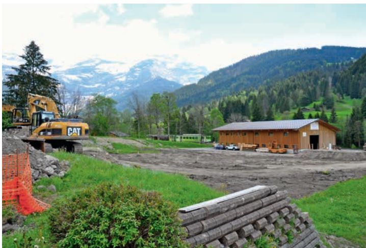
Les travaux de terrassement ont commencé le 24 mai 2017 à l'emplacement du futur bâtiment de la COOP.

Le premier coup de pioche de la nouvelle Coop des Diablerets a été donné le 24 mai 2017. Elle devrait s'ouvrir durant l'été 2018.