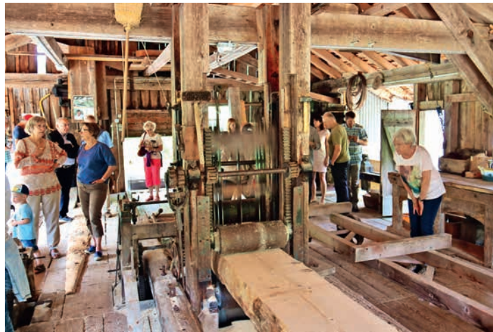
Les dames aussi s'intéressent au fonctionnement de la scie!

Cette réunion était aussi l'occasion de marquer l'entrée du vénérable édifice dans le catalogue des monuments historiques, document signé récemment par Pascal Broulis. L'occasion aussi de remercier les nombreux soutiens qui ont permis de réunir les 100'000 fr. nécessaires à l'acquisition de l'édifice. Sa réhabilitation se montera à 300'000 fr.