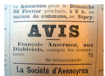
Echo de la Montagne 1897.