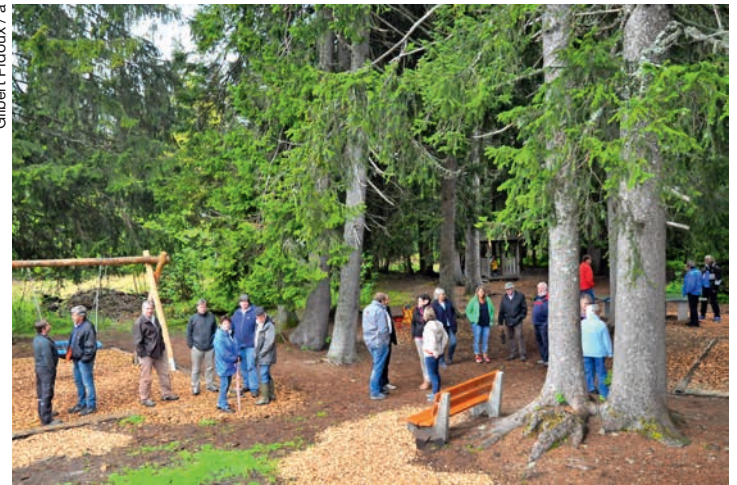
La place de jeux est choyée par Mosses Animation.

Parmi ces nombreuses activités, il a relevé le passage du Tour de France, la Fête Nationale organisée par le Ski Club et le feu d'artifice financé en partie par la SD La Comballaz/Les Voëttes, la remise en état de la place de jeux, l'entretien des sentiers pédestres et de la piste Vita, les marchés-brocantes, activité phare de l'été et dont le succès va croissant. Le manque de neige de cet hiver a incité le comité à organiser un programme «Soleil» très suivi par nos hôtes: cours de zumba, ateliers «cuisine» pour les enfants. Grâce aux remontées mécaniques, le snowtubing a pu fonctionner. Les sympathiques «après-ski»