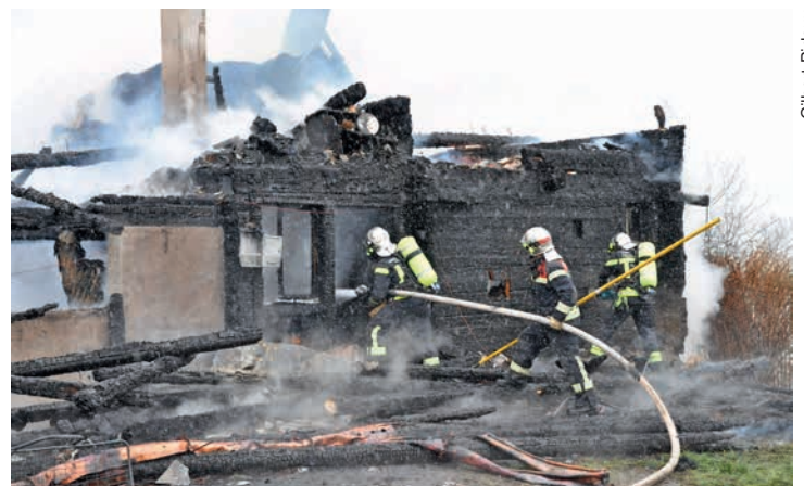
La ferme n'est plus qu'un monceau de ruines.

La propriétaire a pu sortir à temps. Une voisine a donné l'alarme: «Je n'ai jamais vu un chalet s'embraser à une telle vitesse», dit-elle, encore tout émue. Les causes du sinistre sont encore inconnues. (gpx)