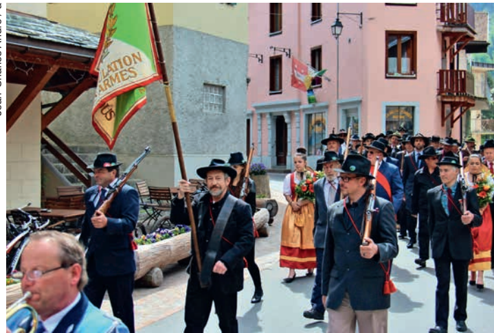
9 mai 2015: parade du Cordon Rouge à travers Le Sépey.