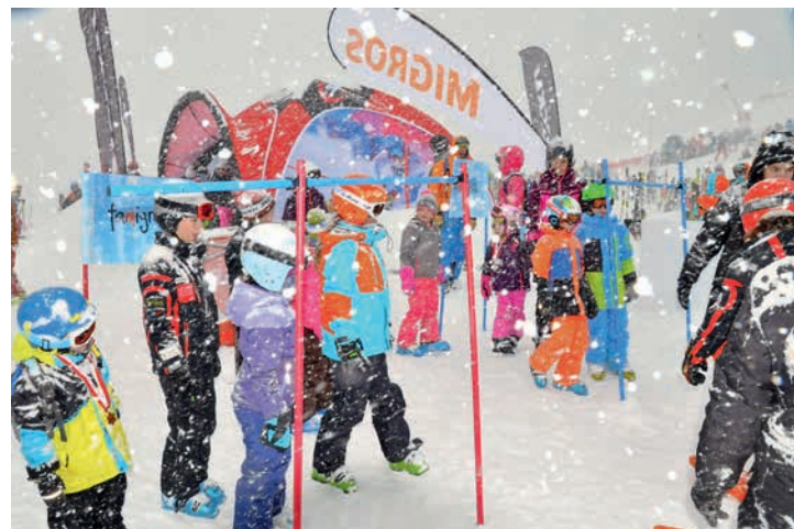
La bourrasque n'entame en rien l'enthousiasme des petits.

Photos et résultats des Ormonans: www.lecotterg.ch Résultats complets: www.gp-migros.ch