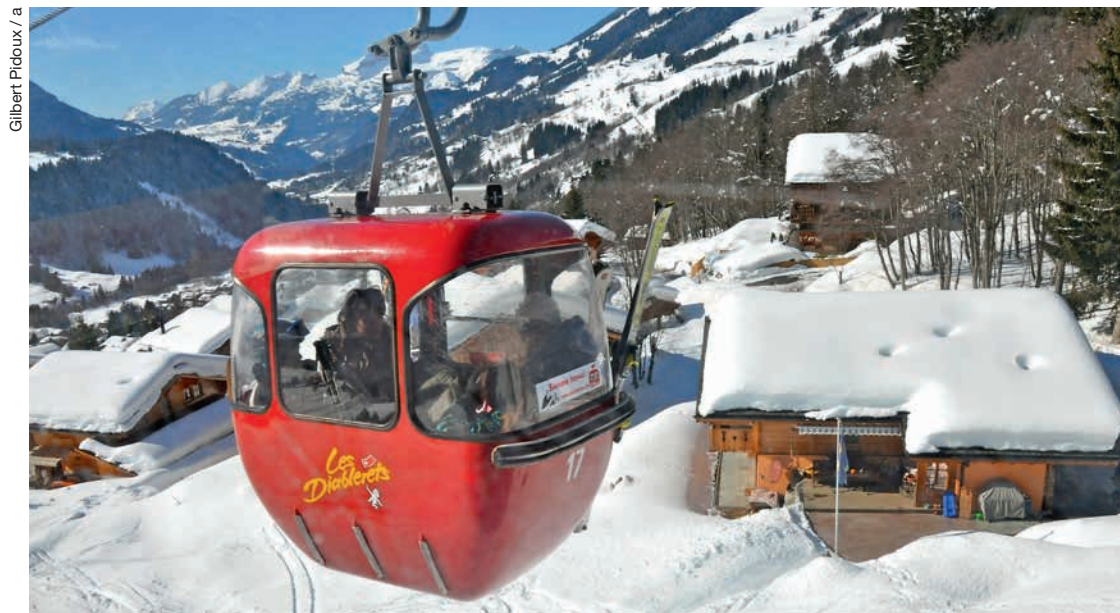
Autorités et TVGD font tout pour que l'avenir d'Isenau ne tienne pas qu'à un fil.

La Municipalité d'Ormont-Dessus porte à la connaissance de ses citoyens et hôtes, la situation actuelle concernant le renouvellement de la télécabine d'Isenau. Suite aux récentes séances avec la société de TéléVillars-Gryon-Diablerets SA (TVGD SA), il a été rappelé et relevé les points suivants: