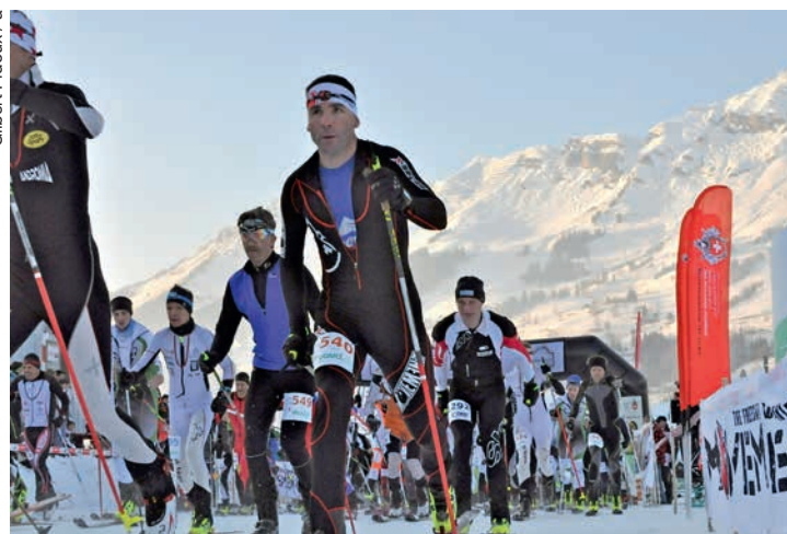
Les concurrents s'élançant, pas avares de leurs efforts.