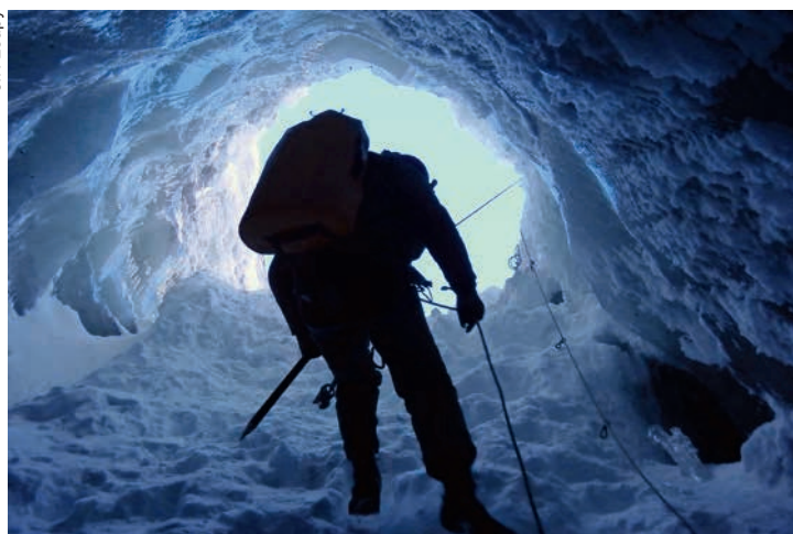
La descente dans le spectaculaire Trou du Diable.

Les dimensions sont généreuses, la première partie de