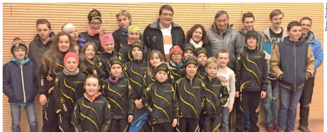
Les Goupils entourent les jubilaires (au dernier rang) de l'ancien Ski-Club Mont-d'Or.