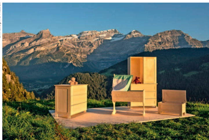
Quelques-uns parmi les meubles fabriqués au Rosex.

net de commandes et trouve une diversification accessoire à son entreprise de menuiserie charpente. Car des boutiques haut de gamme de plaine et de riches stations, s'intéressent aussi à ce produit écologique, naturel, en bois suisse et sans vernis aucun, issu de l'artisanat des Alpes vaudoises. Boutiques haut de