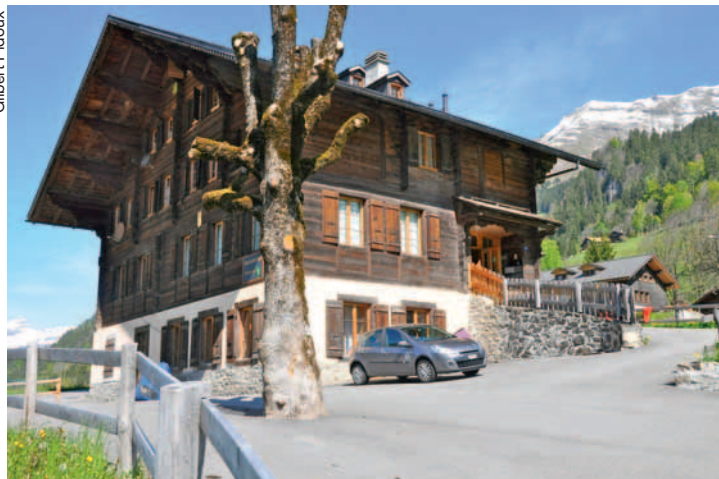
Le bâtiment de la halte-garderie Les Lucioles, à Vers-l'Eglise.