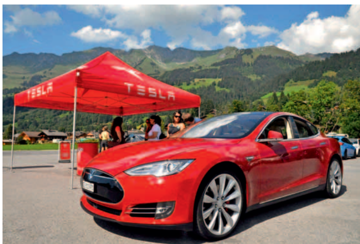
La fameuse Tesla électrique, une attraction fort prisée.

200 participants a été franchi. Le lendemain, à la journée «Mobilités Alternatives, testez-les», organisée par un comité indépendant, une vingtaine de stands présentait des voitures électriques commercialisées, de la Twizy à la Tesla, mais aussi des prototypes dont le bolide Aventor, sans oublier une mobilité cycliste