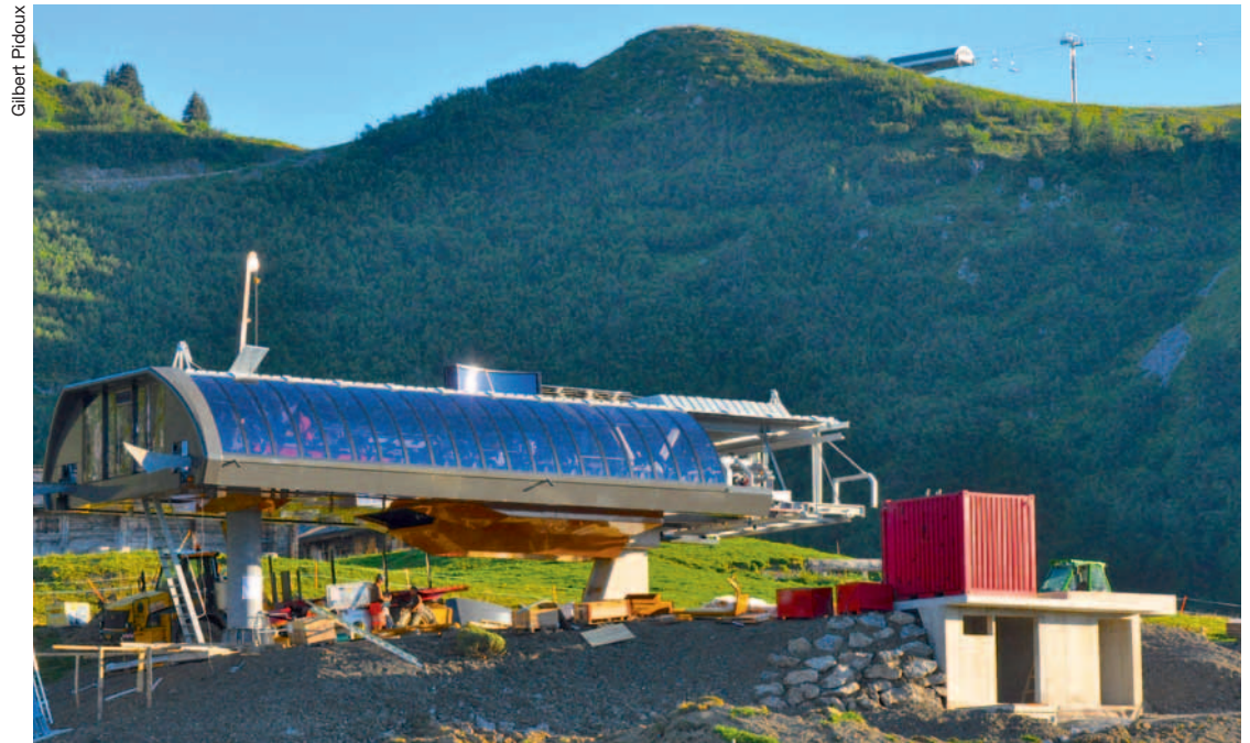
La station d'arrivée de Conche. Tout en haut à droite, on distingue celle de Chaux-Ronde.

Les deux remontées mécaniques modernisées de Télé Villars-Gryon-Diablerets SA (TVGD) – Laouissalet-Meilleret et Perche-Conche – destinées à relier de façon efficace le domaine skiable des Diablerets à celui de Villars sont en plein montage. Elles seront opérationnelles dès l'hiver 2016-2017 et devraient coûter 17 millions de francs.