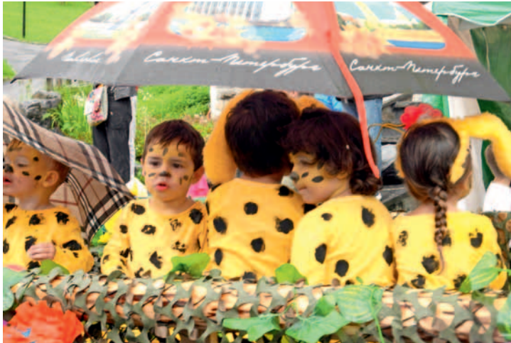
La halte-jeux Les Lucioles a récolté l'adhésion du public.