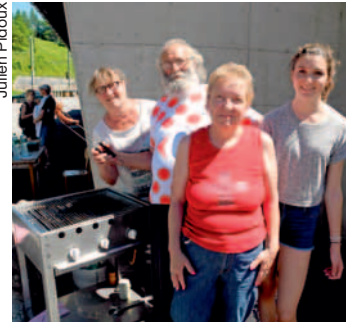
L'équipe de la Société de Développement au Sépey.