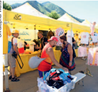
Toute la panoplie du Tour de France au col des Mosses.