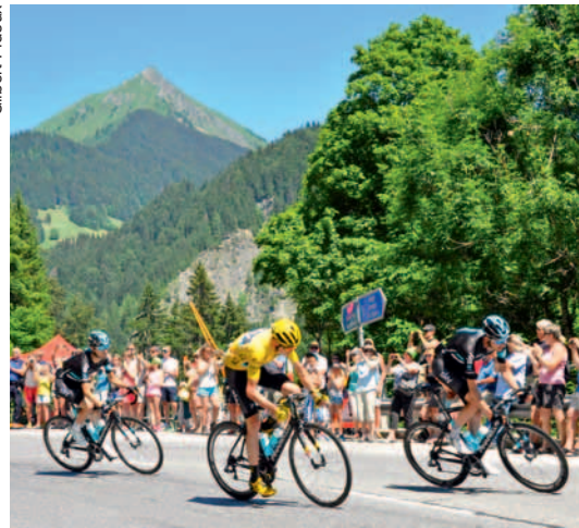
Chris Froome, maillot jaune, à Champ-Pèlerin.

L'étape a été remportée par le Russe Ilnur Zakarin et le maillot jaune est resté solidement accroché aux épaules du Britannique Chris Froome jusqu'à Paris, cinq jours plus tard. Mais était-ce la vraie préoccupation du public, davantage subjugué par la démesure de ce spectacle haut en couleurs, et si éphémère, dans un paysage ensoleillé de carte postale. (gpx)