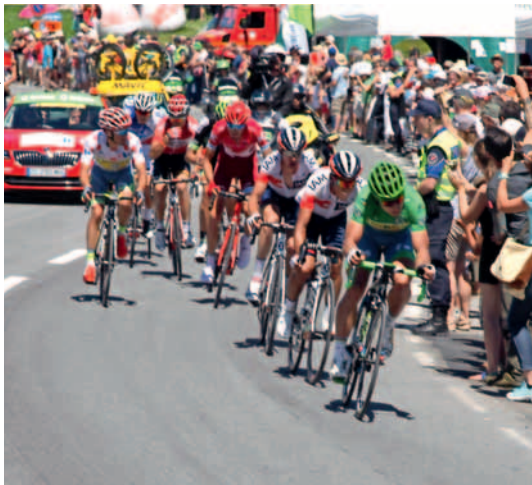
Beaucoup de spectateurs au col des Mosses.

Le mercredi 20 juillet 2016, c'était la fête, lors du passage de la 17 e étape du Tour de France au col des Mosses.