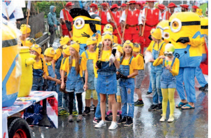
Classé au deuxième rang, le char des Minions gymnastes.

Shrek, panthère rose, schtroumpfs, marsupilami se sont échappés de leurs boîtes de films et des bouquins de bandes dessinées, l'espace d'un week-end (23-24 juillet 2016) pour parader devant les Ormonans et leurs hôtes, aux Diablerets.