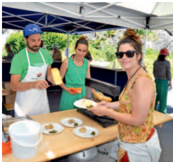
Les raclettes de l'OT des Diablerets à Champ-Pèlerin.