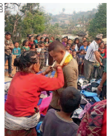
La distribution au Népal.

Mais surprise désagréable à l'arrivée: le conteneur de 800 kg, acheminé par avion, a été bloqué à la douane népalaise qui exigeait 4'500 dollars de taxe. Un montant heureusement rabaisé à 1'800 dollars, grâce à l'intervention d'amis de confiance sur place. Cela,