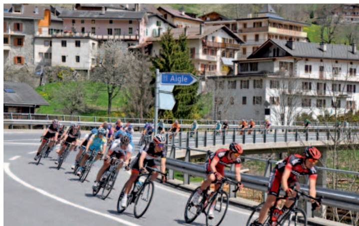
Le Tour de Romandie 2012 au Sépey, c'était déjà prenant. Mais le Tour de France 2016 sera encore plus spectaculaire.

Nous y reviendrons dans Le Cotterg du 15 juillet. (gpx)