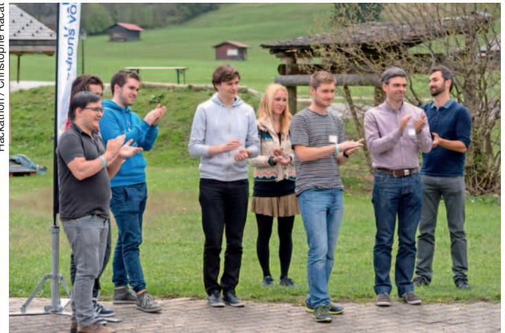
Après 30 h de concours, chaque équipe a présenté son projet sous le feu des questions du jury et des autres participants.

Le hackathon s'est révélé une excellente préparation pour entrer pleinement dans la thématique de la 5 e édition du forum et en faire la promotion. Le forum se déroulera le jeudi 25 août prochain aux Diablerets, sur le thème «Smartvillages, entre technologies et