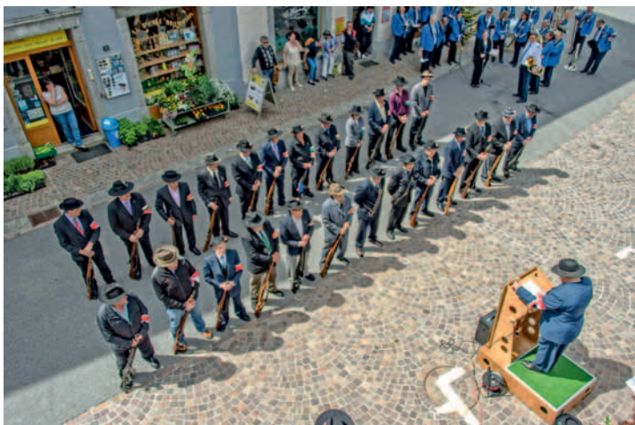
Moment des plus solennels, la proclamation des résultats.