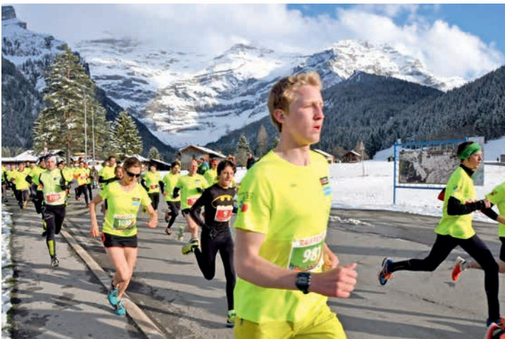
Le départ de la 6 e étape vient d'être donné aux Diablerets.

Ormonan d'ailleurs | Vous avez un message de