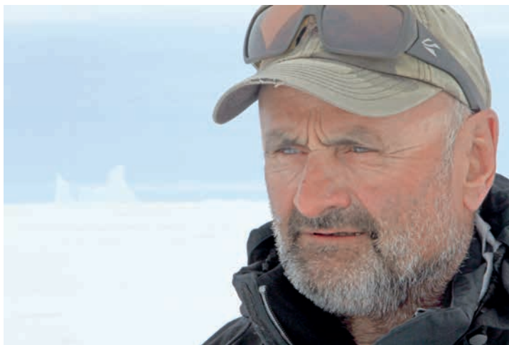
Jean Troillet invité d'honneur: un nouveau livre sortira ce printemps «Une vie à 8'000 mètres», publié aux éditions Guérin.