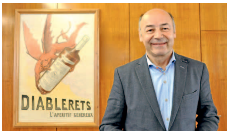
Clin d'œil du Juge aux Ormonts: l'affiche de Frédéric Rouge.