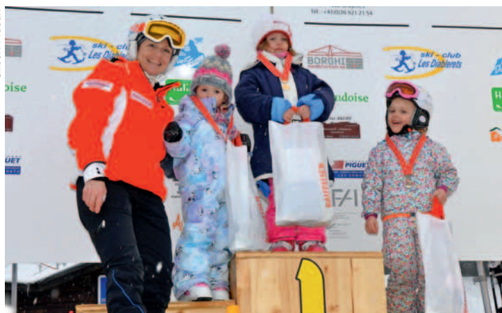
P'tits bouts d'choux seront peut-être les Erika Hess de demain.

Ormonanche d'ailleurs | Vous avez un message de