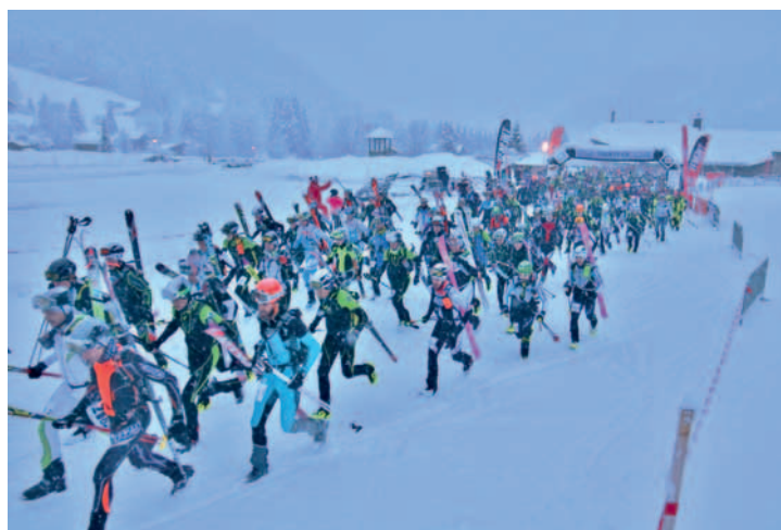
L'impressionnant départ de la Longue distance (Diabolique).

le bon. Il passait à Isenau, à la Pointe d'Arpille (1982 m) et à la Pointe des Vélards (1993 m). Ce tracé très rythmé avec ses six montées, a enchanté les concurrents, dont ceux de la Coupe de Suisse, qui se disputait également ici.