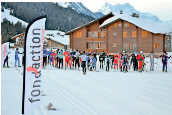
Pas trop de fébrilité avant le départ, chez les populaires. Il en ira sûrement autrement chez les compétiteurs fribourgeois.