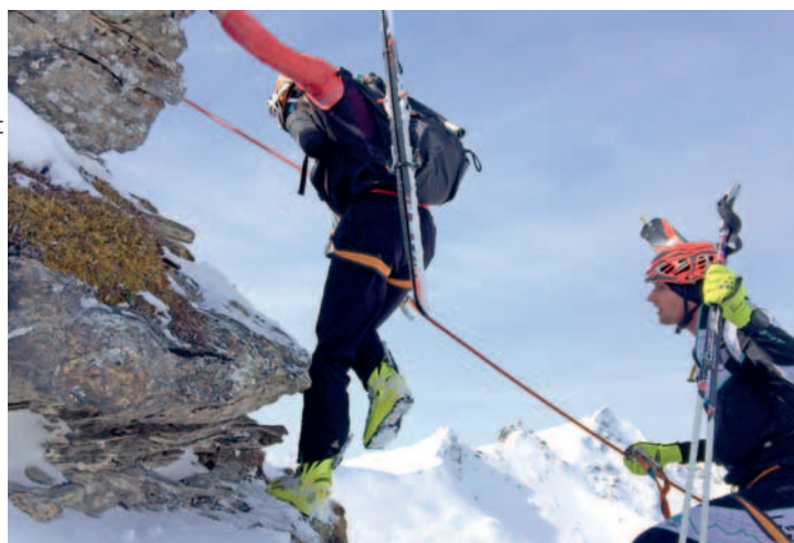
Un passage plutôt délicat et athlétique sur l'arête d'Arnon.