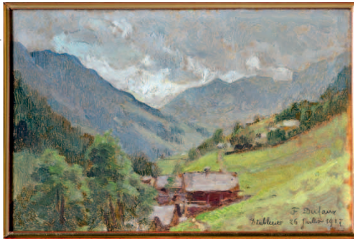
Frédéric Dufaux a peint ce tableau le 26 juillet 1917.

fois de loin, avaient inscrit une visite du Musée à leur programme.»