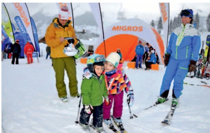
Les tout-petits se sont alignés dans la Mini Race. A droite, l'esquieuse de la Coupe du Monde Cathy Borghi.