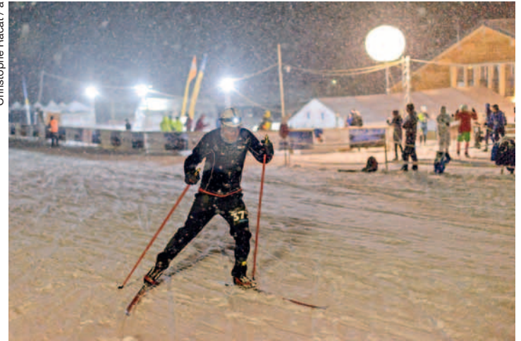
Passage de nuit, devant le Centre Nordique des Mosses.

Une course pour les enfants, par équipes de 3, 4 ou 5, sera également mise en place, le samedi après-midi, entre 13h et 15h, sur le même principe que celle des grands.