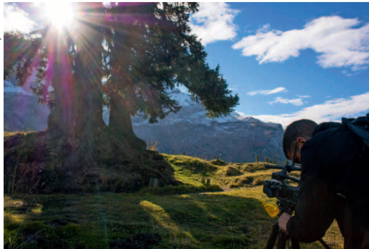
Lionel Charlet parvient à souligner la poésie du monde réel.

boden et Grimentz, aussi. Il apprécie de voir la montagne depuis en bas. Etre au pied de grandes parois de rochers, comme Creux de Champ par exemple.