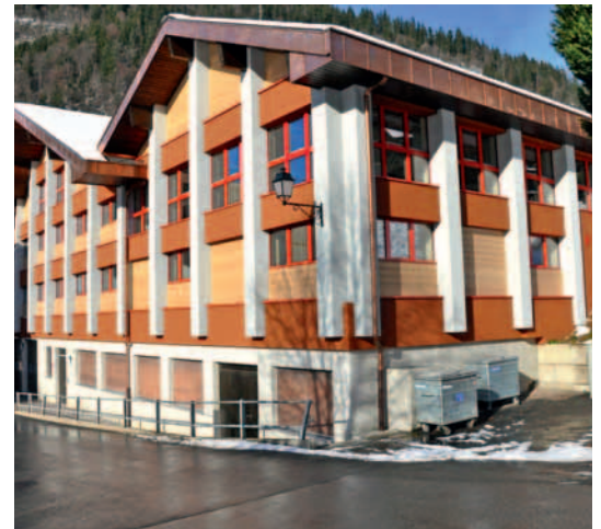
A gauche, le bâtiment de 1984. A droite, le même après les travaux extérieurs d'isolation.

Le bâtiment, séduisant d'aspect, avait été inauguré en avril 1984. Mais on s'aperçut bien vite que les énormes bacs à fleurs en béton qui ornaient sa façade, les dalles, les murs, les piliers en béton étaient autant de ponts de froid. C'est peu dire que le chauffage électrique ne parvenait pas à rendre la température agréable. La commune a profité des travaux pour