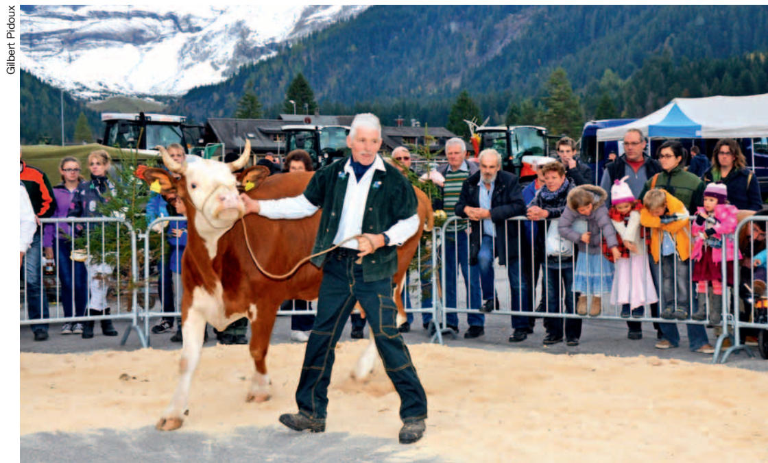
La présentation du bétail attire même les non professionnels. Ici, une vache de la Vallée d'Illiez.

Les visiteurs, et pas seulement les professionnels de l'agriculture, ont été nombreux à se rendre au 8 e Salon des Alpes, aux Diablerets. La manifestation, organisée par Prométerre, la Société vaudoise d'économie alpestre, sous l'égide de Gest'Alp, n'a pas failli à la tradition avec ses présentations de bétail, ses expositions de matériel, sa vente de produits du terroir. Avec, en plus, un débat sur le loup plutôt passionnel et animé.