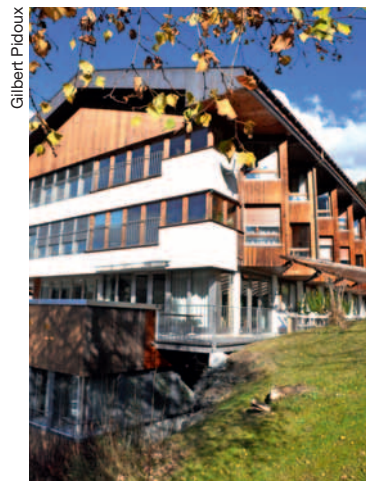
L'EMS «La Résidence».

bénéficiant de l'accompagnement adapté à sa situation. La Résidence des Diablerets, avec 29 lits (occupés actuellement, pour un bon tiers, par des aînés domiciliés à Or-