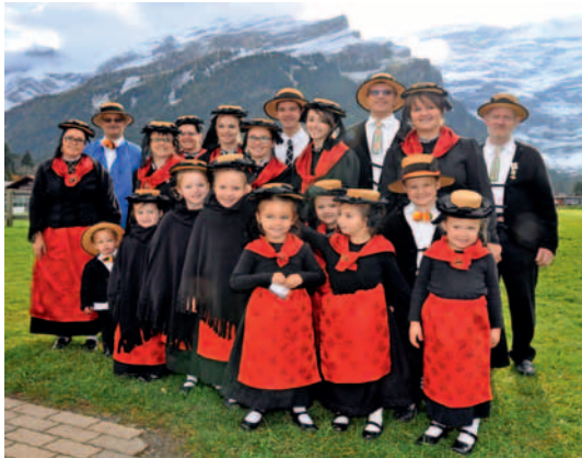
Le groupe folklorique de la Vallée d'Illicz a fait forte impression sur les visiteurs du Salon.