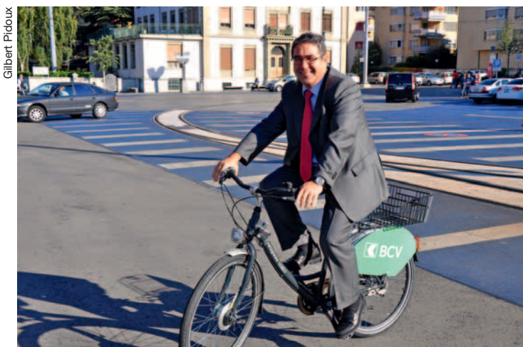
Le sens de l'équilibre est utile à vélo, mais aussi en politique.

Dynamique et fonceur, l'homme s'est voué depuis longtemps à la chose publique avec une efficacité et un sens des responsabilités qui n'ont pas laissé les citoyens indifférents. Ceux des Ormonts lui ont accordé de nombreuses voix, lors des dernières élections fédérales. «J'ai toujours été soutenu par les Ormonts, reconnaît-il. Je pense que c'est le résultat des nombreuses années d'investissement de ma part pour la région et pour le Canton.» Président des Transports publics du Chablais (TPC),