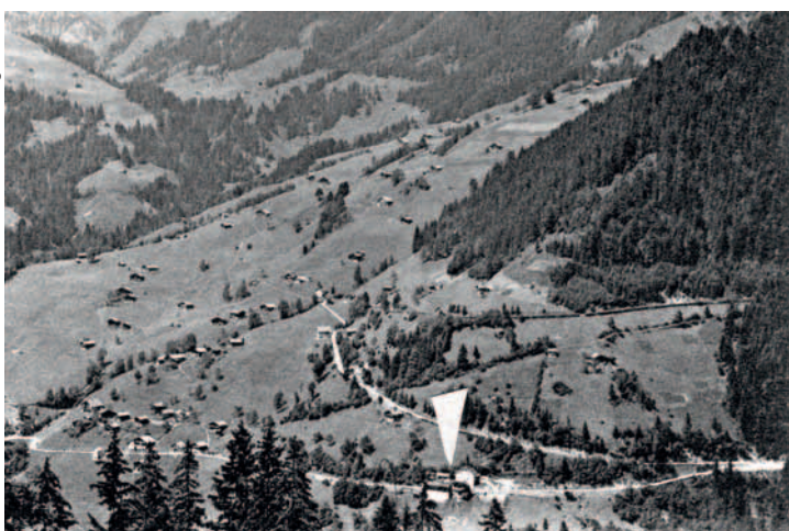
L'Auberge du Champ Pèlerin (flèche) n'existe plus.

Les adresses paraîtront dans Le Cotterg de novembre. (jac)