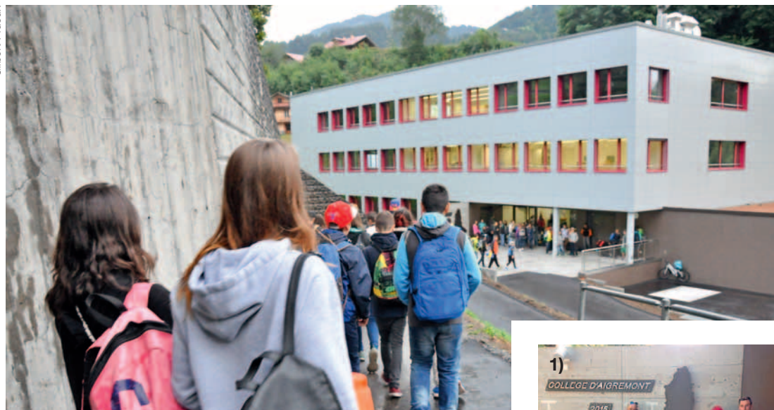
Première rentrée sous la pluie, au petit matin du 24 août 2015.

Rentrée des classes avec un brin d'émotion, le 24 août, au nouveau collège régional d'Aigremont, au Sépey. Environ 120 élèves, issus des deux communes des Ormonts et de Leysin, ont investi pour la première fois les locaux lumineux et modernes. L'enthousiasme pour leur lieu d'études est unanime. Satisfaction également du côté des enseignants.