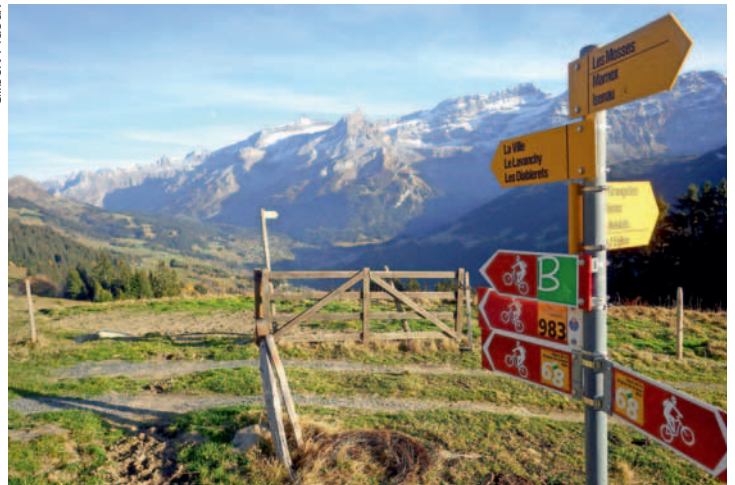
Le choix de beaux itinéraires ne manque pas dans la vallée.

ils débroussaillent, nettoient, déblaient, installent des portillons, fixent des câbles de sécurité, construisent des passerelles, posent des écriteaux de prudence lorsqu'il y a présence de bétail, contrôlent et remplacent les indicateurs, etc. Bien sûr, il y a toujours un risque de se trouver en présence d'un problème qui n'a