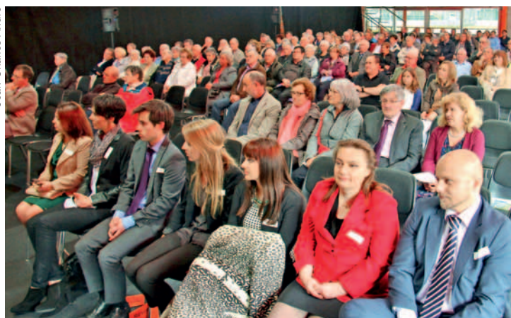
Au premier rang d'une salle comble, les employés Raiffeisen!