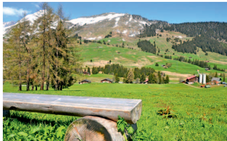
Les coureurs auront-ils le temps d'apprécier ce beau paysage?