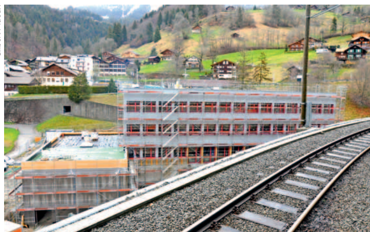
Le nouveau collège régional, au Sépey, a déjà fière allure.

Quant à l'AISOL, qui finance tout l'équipement et le mobilier à hauteur de 1'195'000 francs, elle a déjà fait ses choix – après appels d'offres – pour équiper classes, salles de sciences, cantine et salle de gym. (gpx)