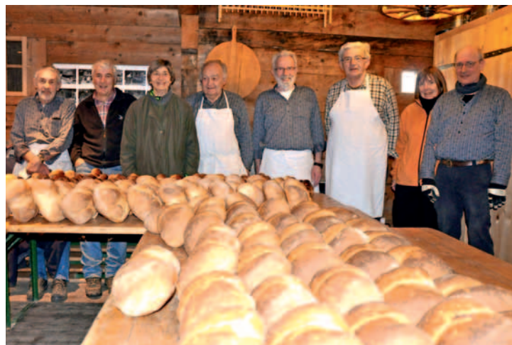
Première fournée parfaite. Les membres ont de quoi être fiers.