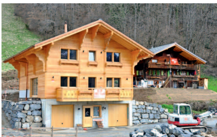
Le chalet est ouvert. Ses alentours seront bientôt terminés.

Un coquet chalet «chambre d'hôtes» s'est construit à Cergnat, en face de l'église.