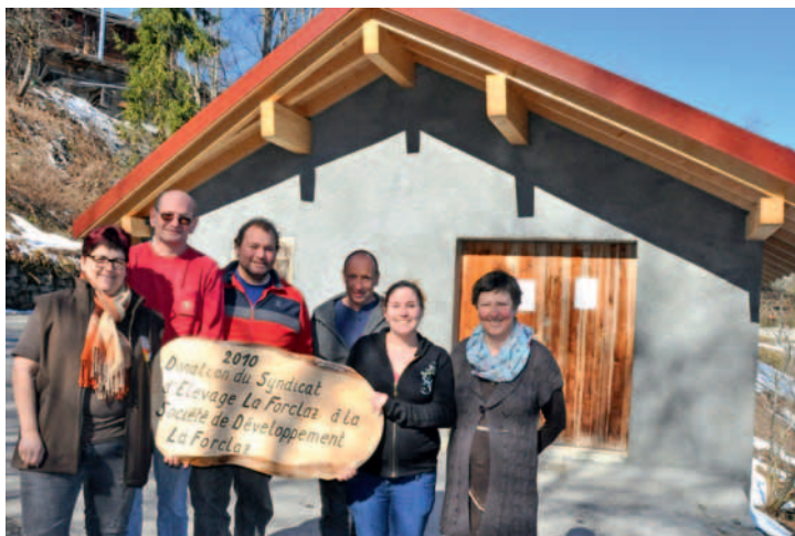
Le comité de la SDF reconnaissant devant son nouveau local.

Samedi de Pâques, le Four à Pain de La Forclaz a rallumé son fournil «à l'ancienne». Lundi, c'était une course aux œufs... très spéciale cette année, de la Société de Développement de La Forclaz (SDF) et l'inauguration de son nouveau local.