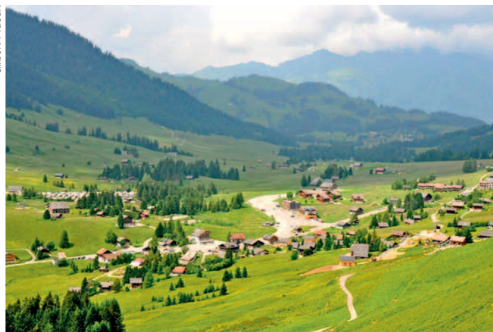
La région des Mosses-La Lécherette est sous haute protection... Pas au détriment de l'activité humaine, assure l'Etat.