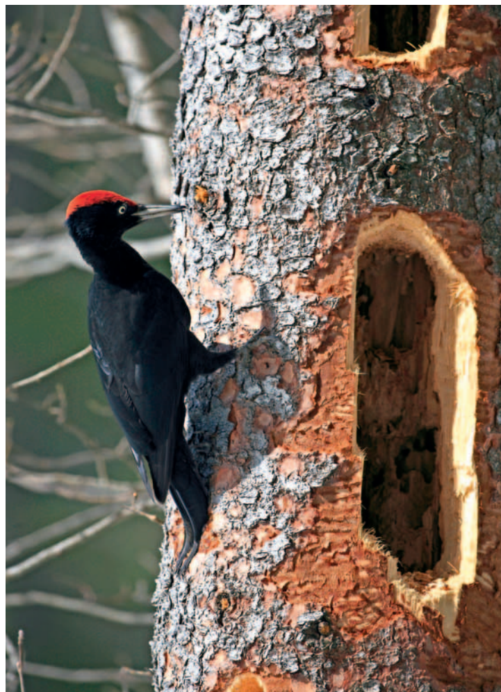
Le pic noir, une photo magnifique prise par Claude Morerod.