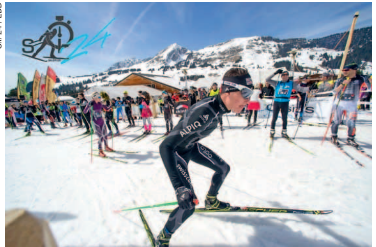
Une ambiance de fête, mais aussi consacrée à l'effort.

Si la manifestation comporte un volet athlétique qui intéresse les licenciés mangeurs de kilomètres, c'est aussi l'occasion d'une rencontre conviviale, sans prétentions chronométriques, pour les amateurs de ski nordique, dont certains arborent des déguisements amusants. L'essence même de la Ski-24 est connue. Il s'agit de se relayer durant 24 h par équipes de 10 au maximum. Quelques audacieux décident de tourner seuls pendant 24 h. En 2014, le team Moustache