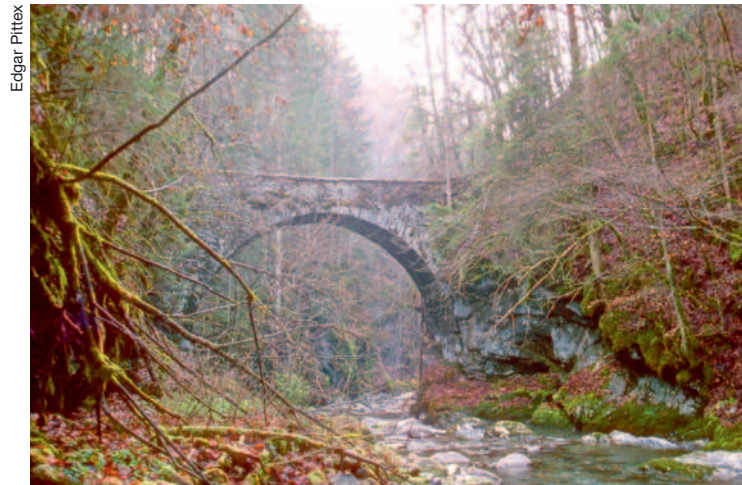
A g, carte postale du pont de La Tine (1912). A d: voûte en plein cintre du pont des Planches.

Il faut descendre tout au fond du vallon de la Grande-Eau, à l'écart du grand trafic, pour découvrir, dissimulés sous les arbres, les anciens ponts de pierre. C'est sûrement en raison de cette position sur des chemins peu utilisés pour celui de La Tine et aujourd'hui abandonnés pour celui des Planches qu'ils ont pu subsister, sans subir aucune transformation mis à part le bétonnage du pied des piles à La Tine dans les années 1970.