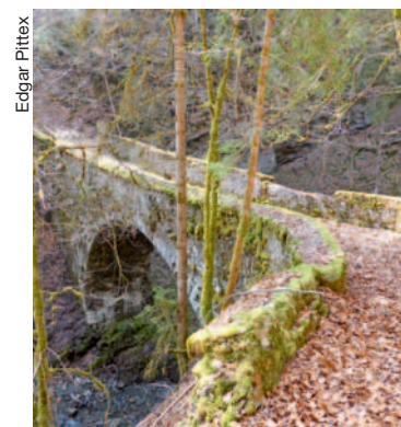
Pont des Planches, dit aussi pont des Moulins vers 1790.

Cet ouvrage ne sera réalisé qu'en 1778 après plusieurs