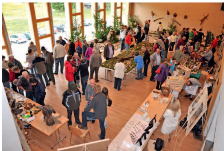
L'an dernier, de nombreux visiteurs ont fait le tour des stands... et réjoui leurs papilles à la cantine richement garnie.