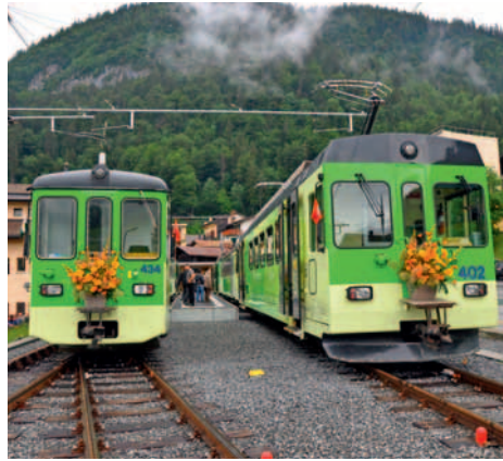
2 juillet. Deux trains d'invités pour l'inauguration de la nouvelle gare du Sépey.