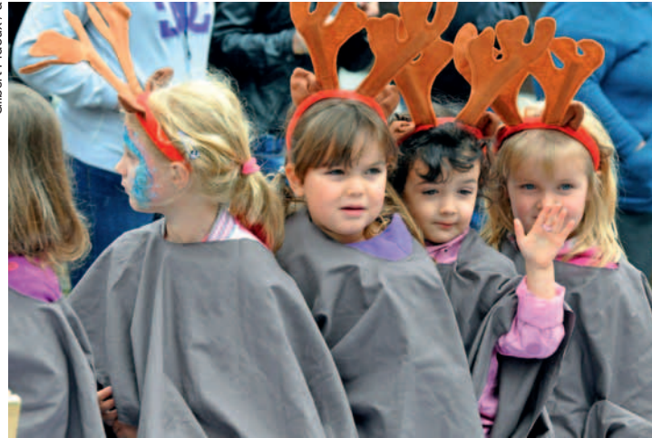
Les enfants du Corso attendrissent toujours un public conquis.

Le thème de cette année est la magie. De quoi lâcher la bride à une imagination débordante pour un Corso, dont le défilé est à chaque fois un régal pour les yeux des petits et des grands. Les spectateurs devront donc s'attendre à des surprises originales, à l'apparition de toutes sortes de personnages mystérieux, à l'irruption de créatures fantasmagoriques, de sorcières, de fées, de magiciennes et de magiciens, toujours prêts à jouer un bon tour. Comme cela se pratique de-