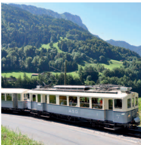
6 juillet. Le train historique, peint comme en 1914 par l'Association ASD 1914.