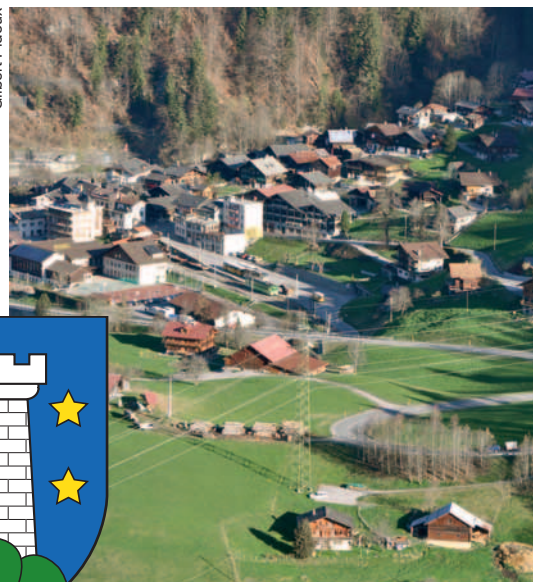
Ormont-Dessous: Le Sépey