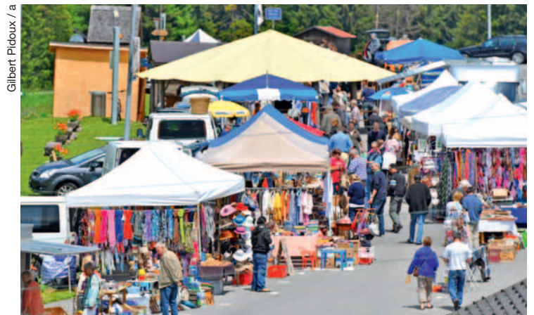
De belles trouvailles en perspective pour les farouilleurs.