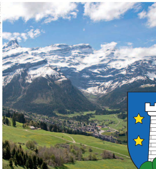
Ormont-Dessus: Les Diablerets