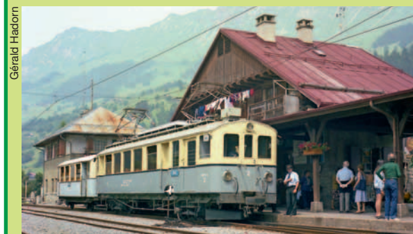
5 août 1978: une image typique aux Diablerets, qui perdurera plus de 40 ans.