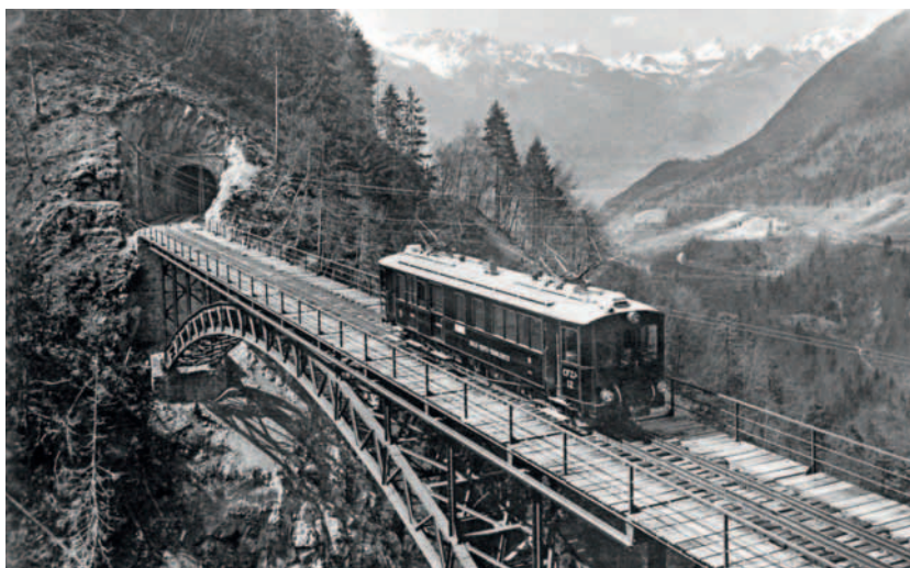
94 m au-dessus du Ravin! Le pont du Vanel au printemps 1914.