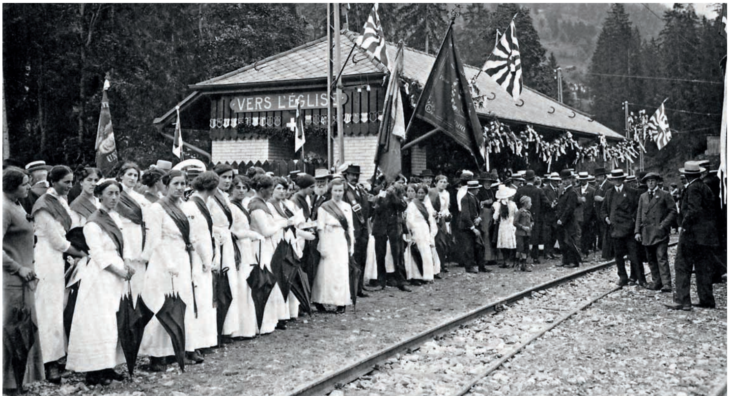
Le 6 juillet 1914 à Vers-l'Église, la foule attend le train inaugural. Le temps est menaçant, à voir le nombre de parapluies.