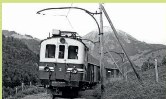
En 1987, un train de désalpe avec ses wagons à bétail. Notez la ligne de contact typique de l'ASD.