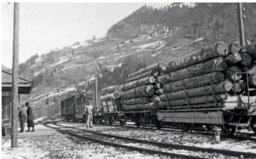
Gros transport de bois durant la guerre 1914-1918, à Exergillod.