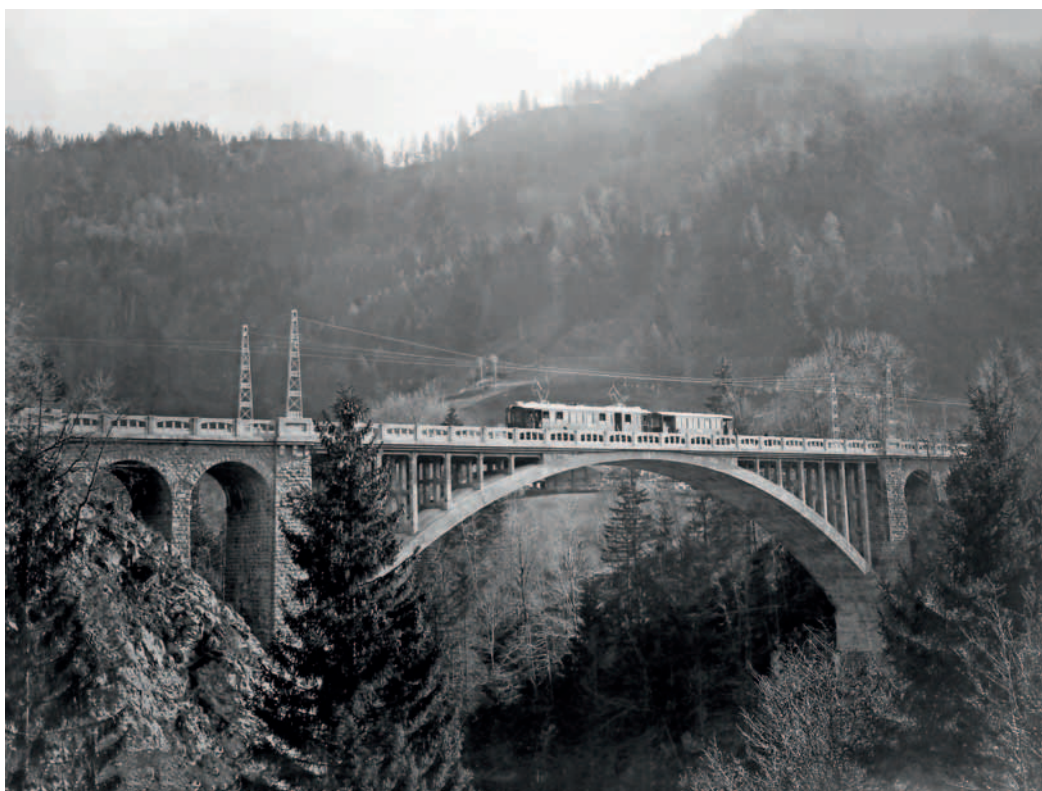
Innovant, le pont des Planches est conçu par une structure métallique enrobée de béton.

S ur une longueur exploitée de 22,37 km, le train gravit 753 m, traverse 6 tunnels et franchit 33 ponts. Le plus impressionnant, au Vanel, est haut de 94 m.