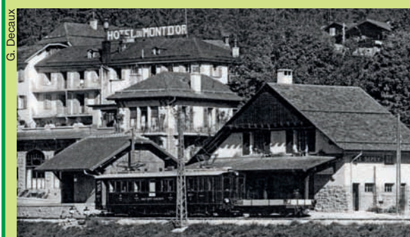
La gare du Sépey peu après l'ouverture de la ligne

Des notes historiques et techniques complètent cet ouvrage de 164 pages, disponible dès le 3 juillet 2014 au prix de 38 francs au Musée des Ormonts, à Vers-l'Eglise (024 492 17 71) et auprès de l'Association ASD 1914 ( www.asd1914.com ).