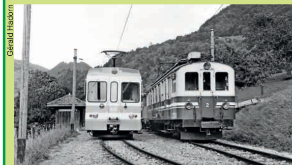
Le 5 octobre 1987, locomotives ancienne et moderne se côtoient à Exergillod.