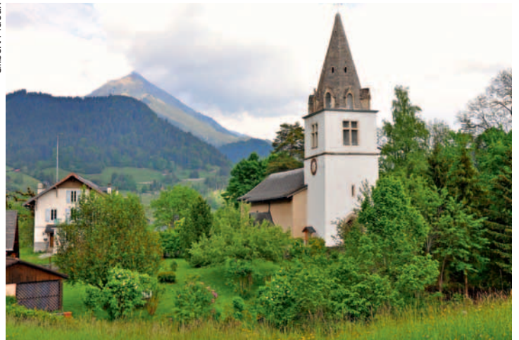
Le trajet offre une vision panoramique sur l'église de Cergnat.