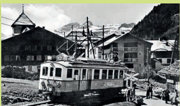
Dans les années 40, au passage à niveau de Vers-l'Eglise. En arrière-plan, l'Hôtel de l'Ours.