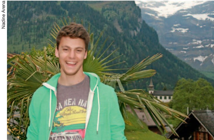
Au hockey, j'ai fait des rencontres qui m'ont ouvert l'esprit!

-J'ai toujours été attiré par les «vroum-vroum» (rires!). Je suis quelqu'un de manuel. J'ai fait de nombreux stages et tout