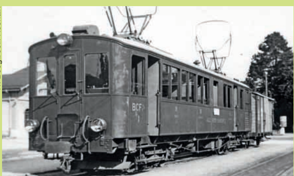
1939: cette vénérable locomotive est prête au départ sur la place de la gare d'Aigle.