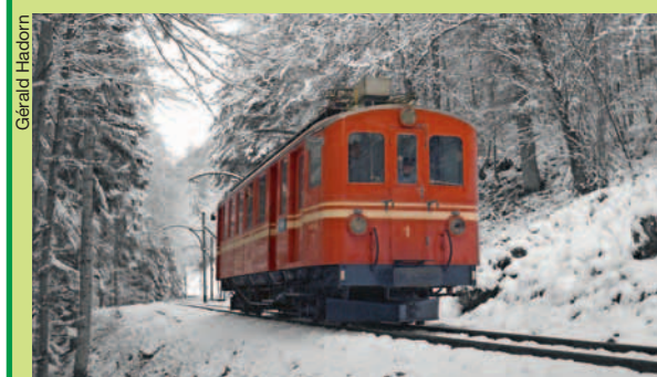
Le 18 mars 1978, la fameuse locomotive orange, entre Plambuit et Verschiez.