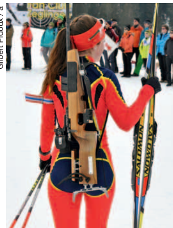
La biathlon, version féminine.