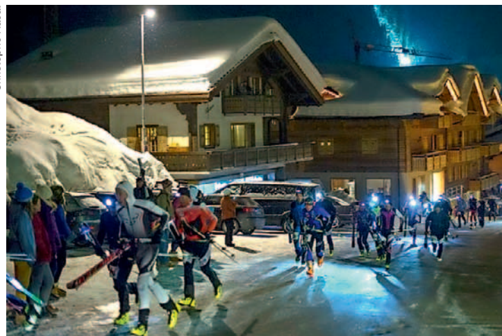
La nuit ajoute un élément magique à la course.

Tiré des ouvrages de Henri Roorda parus aux Editions Humus Le pessimisme joyeux ou Les Almanachs Balthasar .