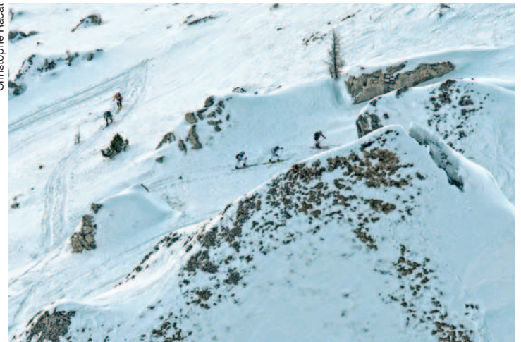
En plein effort dans la montée de Pierres-Pointes.

Le Super Relais – Dimanche 2 mars. Départ des 2 manches 8h45 et 10h00. Deux boucles près des Vioz. Passage du témoin sur le terrain de foot. Record à battre: 27 min 7 sec, par Reynold Ginier et Adrien Croisier, le 5 février 2011.