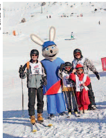
Une affiche sympathique.

Col des Mosses | Un grand rendez-vous au sommet