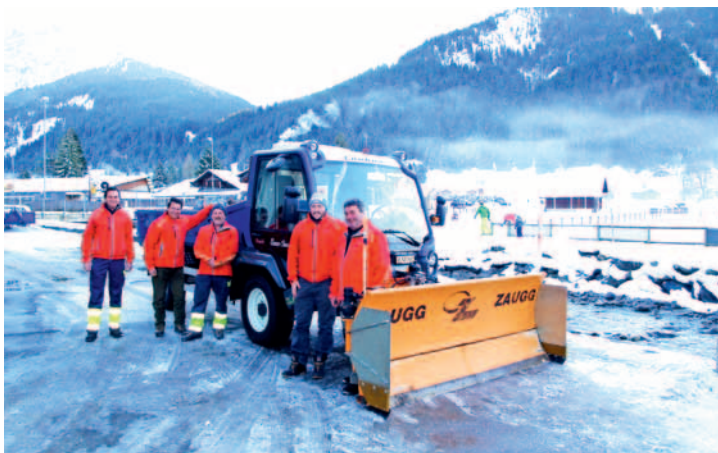
Les employés du Service des Travaux d'Ormont-Dessus devant le nouveau Lindner.