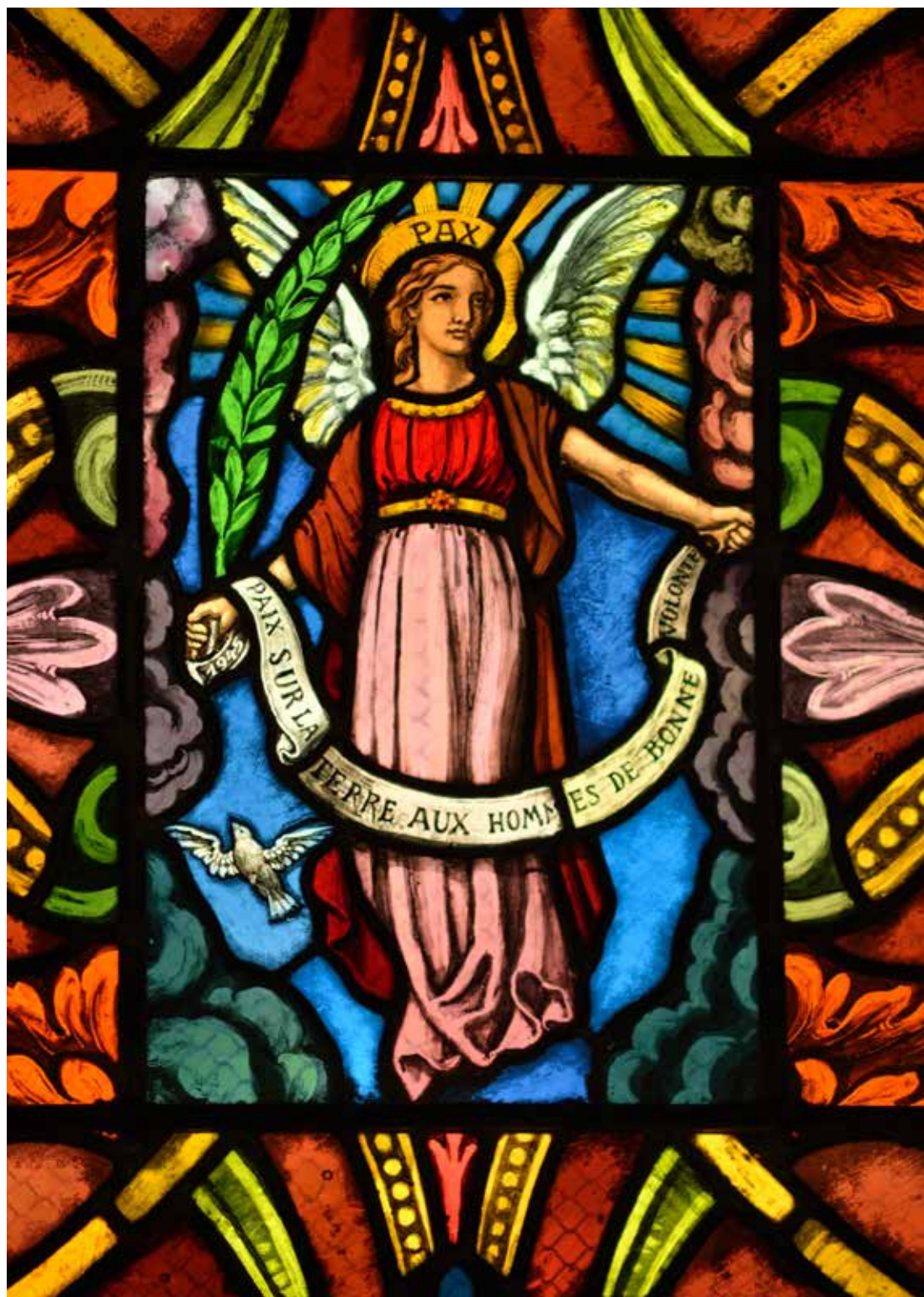
Vue partielle d'un des magnifiques vitraux du temple de Vers-l'Eglise.