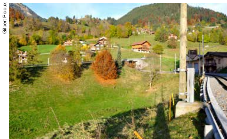
Le terrain où sera construit le futur complexe scolaire.