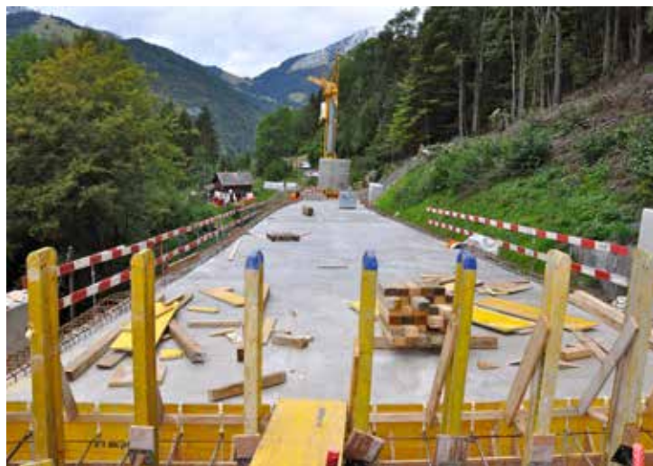
Ouvrage devisé à 4,6 millions, le pont du Bouillet doit pallier un affaissement récurrent du terrain à cet endroit.