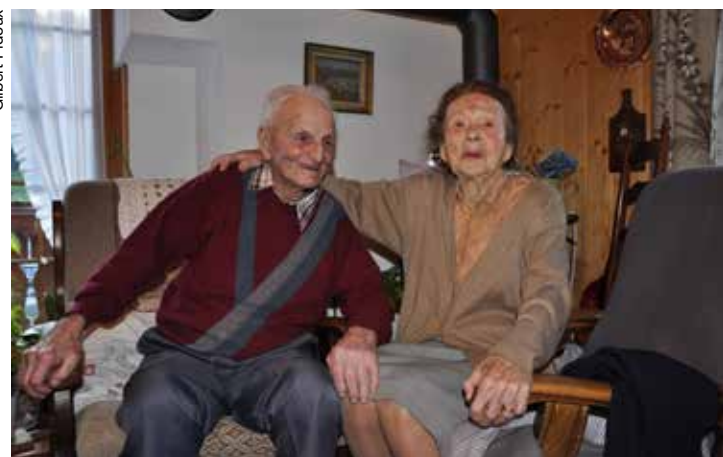
Encore touchants de tendresse, après 71 ans de mariage...