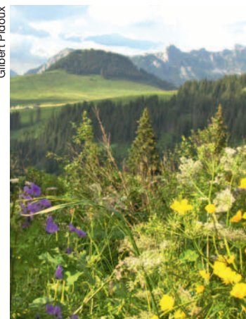
Les plantes renferment des trésors à découvrir.