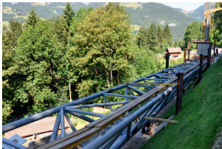
Le caisson du pont sera recouvert de dalles et de béton.