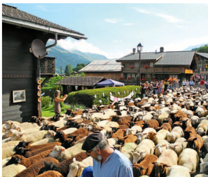
Un fleuve de moutons s'écoule à travers le village de La Forclaz