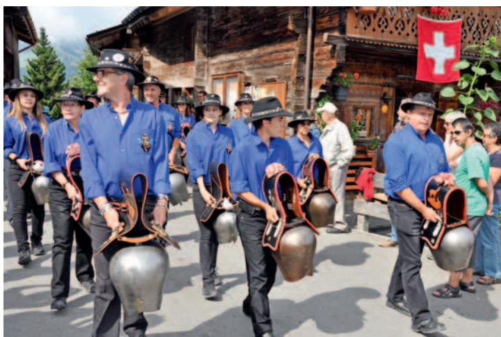
Les Sonneurs de cloches des Ormonts mettent une ambiance tonitruante et participent à nombre de fêtes dans la région.