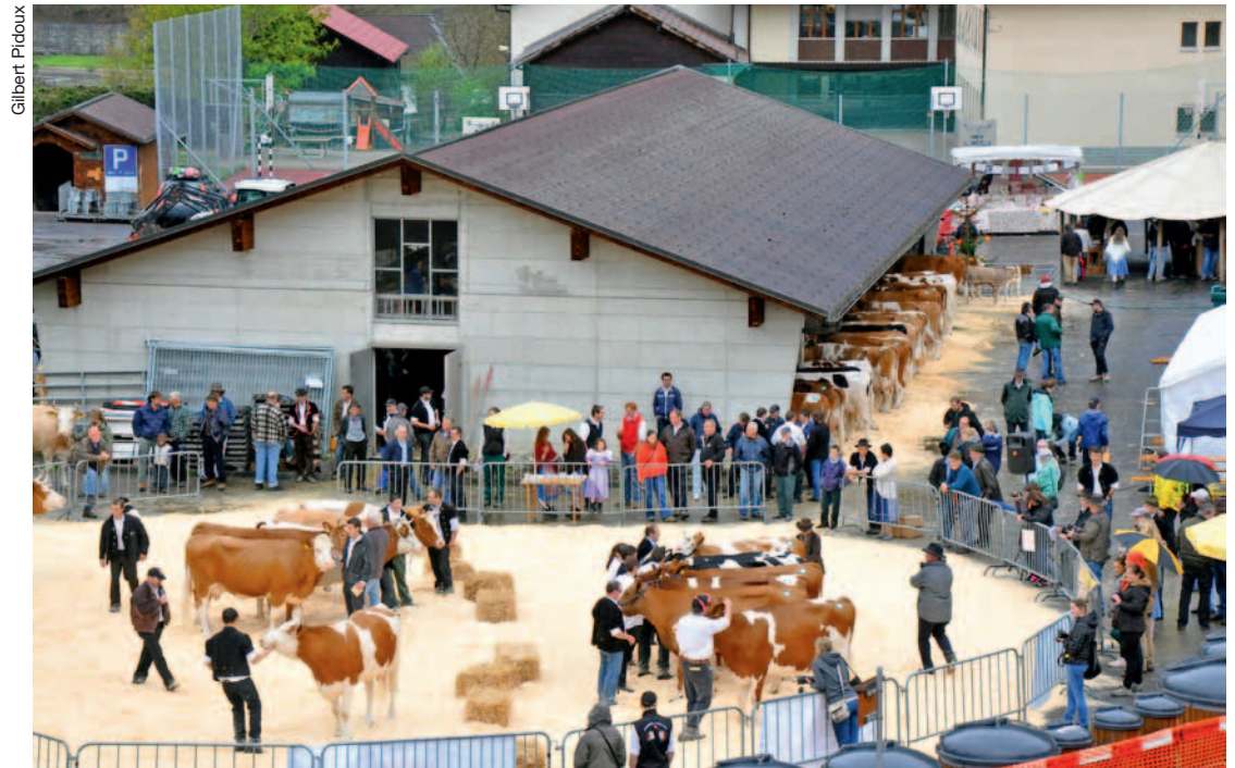
Marché couvert du Sépey. Le concours du bétail, une fête aux origines ancestrales.

Quelque cent vaches laitières, génisses et veaux ont été présentés à l'expo concours qui s'est tenue au Sépey, devant un aréopage d'agriculteurs à l'œil exercé et un public conquis.