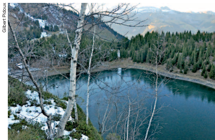
Bien s'équiper évite des problèmes en randonnée. Ici, le sentier bucolique qui longe la berge du lac des Chavonnes.