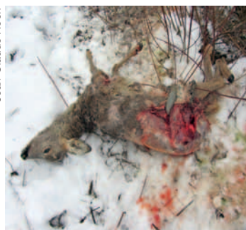
Triste spectacle: un chevreuil attaqué par des chiens.

Georges Pernet | Membre de l'Echo des Alpes depuis 1933