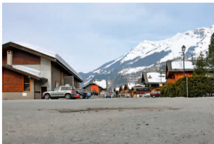
Les Diablerets, av. de la Gare: dernière ligne droite et arrivée ici.