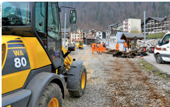
Fin du premier jour: l'ancienne gare du Sépey n'est déjà plus qu'un souvenir, après l'intervention d'une dizaine d'ouvriers.