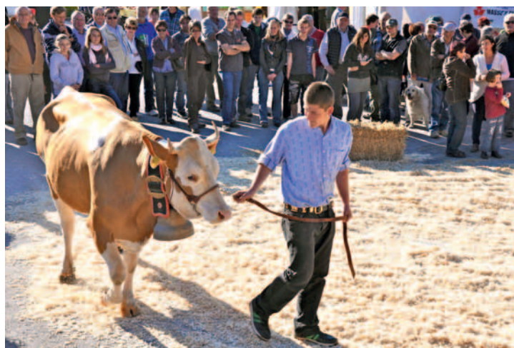
Pour être jugées, les vaches seront présentées sur un ring, comme ici, l'an dernier, lors d'un concours aux Diablerets.