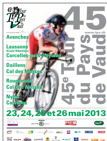
L'affiche du TPV 2013.