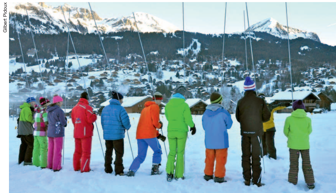
Les Diablerets: manier la sonde requiert une formation pour rendre l'opération efficace.