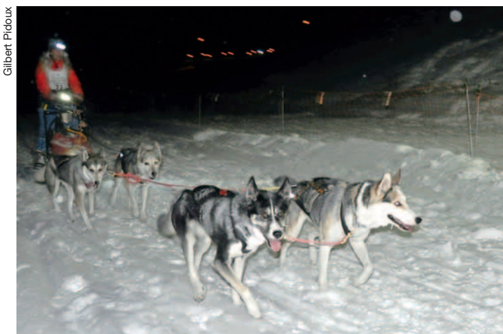
C'était le 31 janvier 2012, l'arrivée nocturne au col des Mosses.

Cette course, réservée jusqu'ici aux chiens pure race, sera pour la première fois ouverte aux mushers sans chiens pure race. Le comité a décidé de répondre à une demande importante, permettant ainsi à tous de participer, en ajoutant