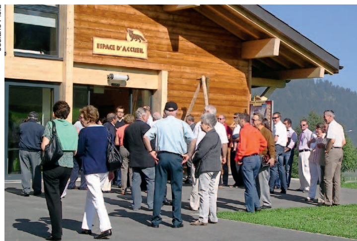
Public et actionnaires entrent dans la Maison de L'Espace Nordique, au col des Mosses, où se tiendra l'assemblée générale.

Les résultats de l'exercice sont bons, sans plus. L'été 2011 a été particulièrement mauvais. Quant à l'hiver, bien enneigé, il a été court et a posé bien des