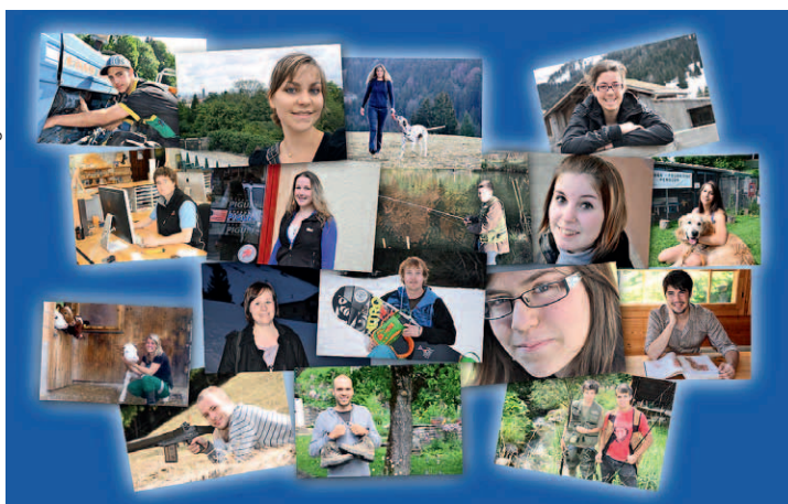
Les jeunes Ormonans ne manquent pas de qualités.

membres engagés d'une société, pensant aussi à l'avenir de la région.